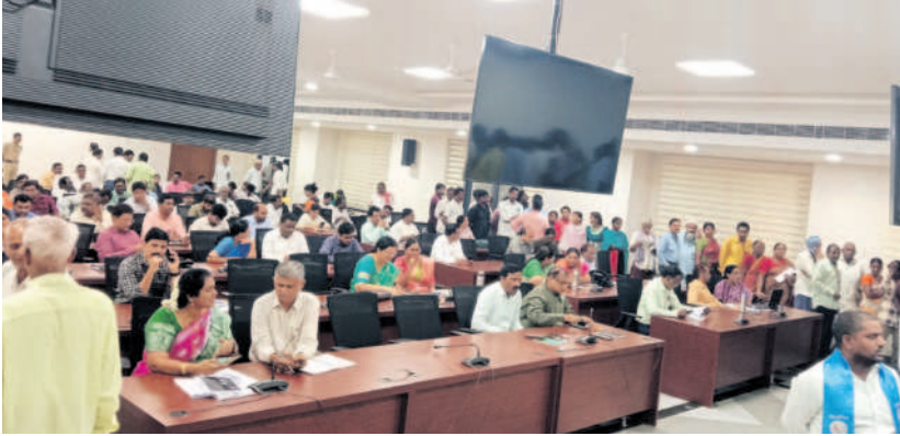
ప్రజావాణికి బారులు తీరిన ఫిర్యాదుదారులు (ఫైల్)

భద్రాద్రి కొత్తగూడెం, డిసెంబర్ 6 (నమస్తే తెలంగాణ) : ప్రజావాణిలో పలు సమస్యలపై బాధితులు సమర్పించిన దరఖాస్తులు అంతంతమాత్రంగానే పరిష్కారమవుతున్నాయి. కలెక్టరేట్లో వారం వారం ప్రజావాణి(గ్రీవెన్స్) కార్యక్రమం నిర్వహిస్తున్నామని చెబుతున్నా.. ఇందులో రద్దు చేసిన కార్యక్రమాల్లో ఎక్కువగా కనిపిస్తున్నాయి. దీంతో సుదూర ప్రాంతాల నుంచి వచ్చి తమ సమస్యలపై అల్లీలు సమర్పించేందుకు ప్రజలు ఆసక్తి చూపడం లేదని తెలుస్తున్నది. మాది ప్రజా పాలన అని గొప్పలు చెప్పుకుంటున్న కాంగ్రెస్ ప్రభుత్వం గ్రీవెన్స్ నిర్వహణలో క్షేత్రస్థాయిలోనే విఫలమైందనే విమర్శలు వినిపిస్తున్నాయి. కలెక్టర్ గ్రీవెన్స్లో ప్రజల నుంచి వినతులు స్వీకరించాల్సి ఉండగా.. వివిధ పనుల్లో బీజేపీ ఉండడం వల్ల అదనపు కలెక్టర్లు, ఆర్టీవో ఆ కార్యక్రమాన్ని నడిపించాల్సిన పరిస్థితి ఏర్పడింది. తమ అపరిష్కృత సమస్యలపై వినతులు సమర్పించినా ఎంతకూ పరిష్కారం కాకపోవడంతో ప్రజలు విసుగు చెందుతున్నారు. దీనికి అల్లీలు సమర్పించడం ఎందుకని చర్చించుకుంటున్నారు.