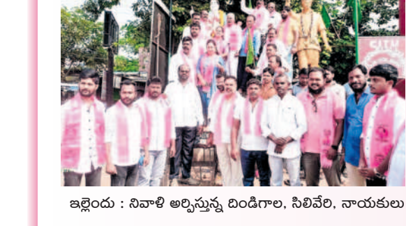
ఇల్లందు : నివాళి అర్పిస్తున్న దిండిగల, సిలివేరి, నాయకులు