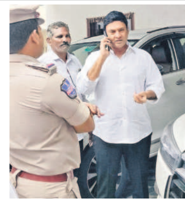
బోయిన్పల్లిలోని క్యాంప్ కార్యాలయంలో ఎమ్మెల్యే మర్రి రాజశేఖరరెడ్డిని హోస్ అరెస్టు చేస్తున్న పోలీసులు