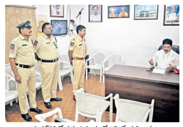
కుశాబద్లో గృహ నిర్బంధంలో ఎమ్మెల్యే కృష్ణారావు