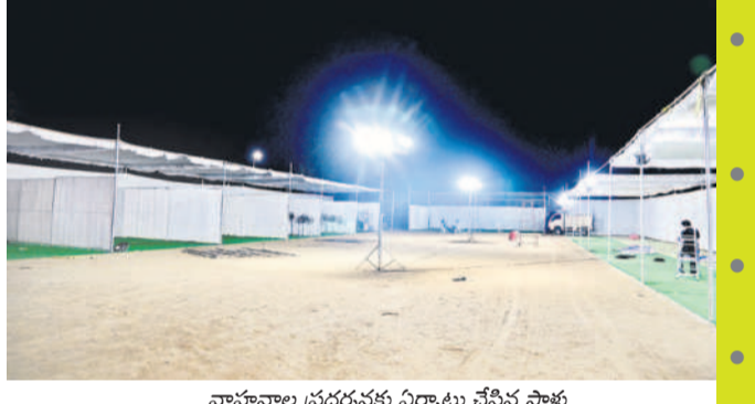
వాహనాల ప్రదర్శనకు ఏర్పాటు చేసిన స్టాళ్లు