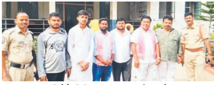
ఆర్యారంలో బీఆర్ఎస్ నాయకులను అరెస్టు చేసిన పోలీసులు