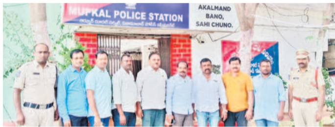
ముప్పాల్లో బీఆర్ఎస్ నాయకులను అరెస్టు చేసిన పోలీసులు

సన చేసే హక్కు లేకుండా చేసిన పోలీసులు, ప్రభుత్వ తీరుపై గులాబీ శ్రేణులు మండిపడ్డాయి. పోలీసు బలగాలతో ఆందోళనలు ర్గాల వ్యాప్తంగా బీఆర్ఎస్ నేతలు, కార్యకర్తలను అరెస్టు చేశారు. ప్రజాస్వామ్యంలో నిర