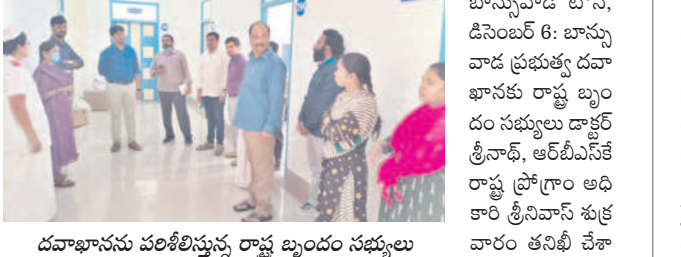
దవాఖానను పరిశీలిస్తున్న రాష్ట్ర బృందం సభ్యులు