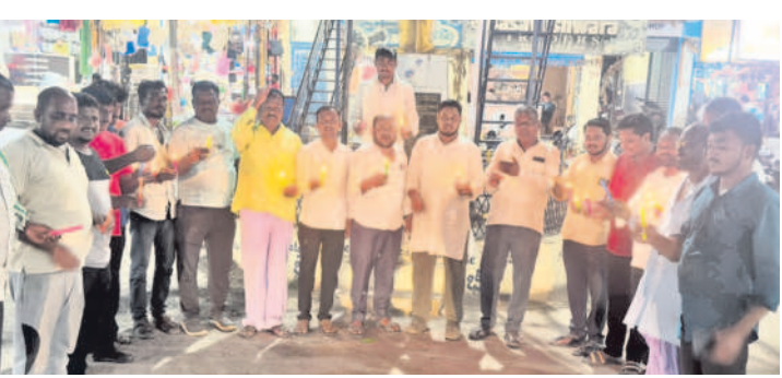
జుక్కల్లో నివాళులర్పిస్తున్న నాయకులు