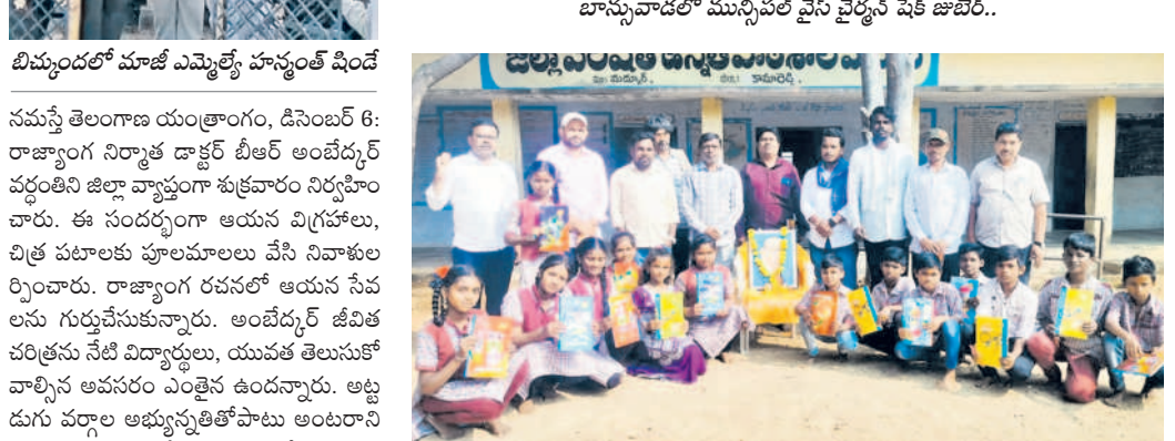
మద్దూర్ మండలం మేనూర్లో విద్యార్థుల నోటు పుస్తకాలు పంపిణీ చేస్తున్న నాయకులు