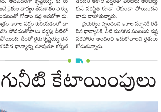
అకాల వర్షానికి తడిసిన ధాన్యాన్ని చూపిస్తున్న రైతు దంపతులు

ప్రభుత్వం స్పందించి అకాల వర్షానికి తడిసిన ధాన్యానికి, నీటి మునిగిన పంటలకు సహకారం అందించి ఆదుకోవాలని రైతులు కోరుతున్నారు.