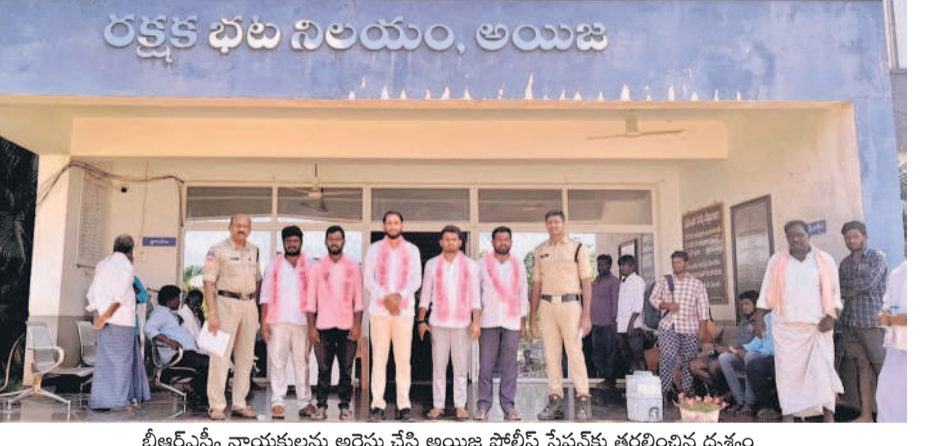
బీఆర్ఎస్ నాయకులను అరెస్టు చేసి అయిజు పోలీస్ స్టేషన్ కు తరలించిన దృశ్యం