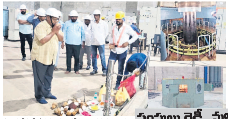
పట్టం పంపహాస్లో గురువారం డ్రైవర్స్ సొంత భిక్షువు అధికారులు

పట్టం పంపహాస్లో గురువారం డ్రైవర్స్ సొంత భిక్షువు అధికారులు మహబూబ్ నగర్, డిసెంబర్ 6 (నమస్తే తెలంగాణ ప్రతినిధి) : పాలమూరు-రంగారెడ్డి ఎత్తిపోతల పథకంలో భాగంగా నిర్మిస్తున్న వట్టం రిజర్వాయర్లో ఐదు బాహుబలి చంపులను మన ఇంజనీర్లు రెడీ చేశారు. గురువారం మొదటి చంపు విజయవంతంగా పరీక్షించడంతో ఇంజనీర్ల ఆనందం అంతా ఇంత కాదు. మిగతా నాలుగు చంపులు కూడా డ్రైవర్స్ సిద్ధంగా ఉన్నట్లు ఇంజనీరింగ్ అధికారులు ప్రకటించారు. పాలమూరు పథకంలో భాగంగా ప్రధానమైన పాత పోషిచివే వట్టం రిజర్వాయర్ పూర్తి కావడం.. పంపహాస్లోని మోటర్లన్నీ సిద్ధం కావడంతో రైతులు బాధ్యం వ్యక్తం చేస్తున్నారు. ఈ రిజర్వాయర్ నుంచి కృష్ణా జిల్లా ఉమ్మడి మహబూబ్ నగర్లోపాటు పాలు రంగారెడ్డి, నల్లగొండ జిల్లాలకు వెళ్తాయి. భవిష్యత్లో రాజధాని నగరానికి కూడా తాగునీరు అందించేందుకు ఉద్దేశించిన ఈ పథకం కీలక ఘట్టం పూర్తి కావడం.. ఈ పథకానికి శ్రీకారం చుట్టిన కేసీఆర్ ప్రయత్నం సఫలీకృతమైంది.