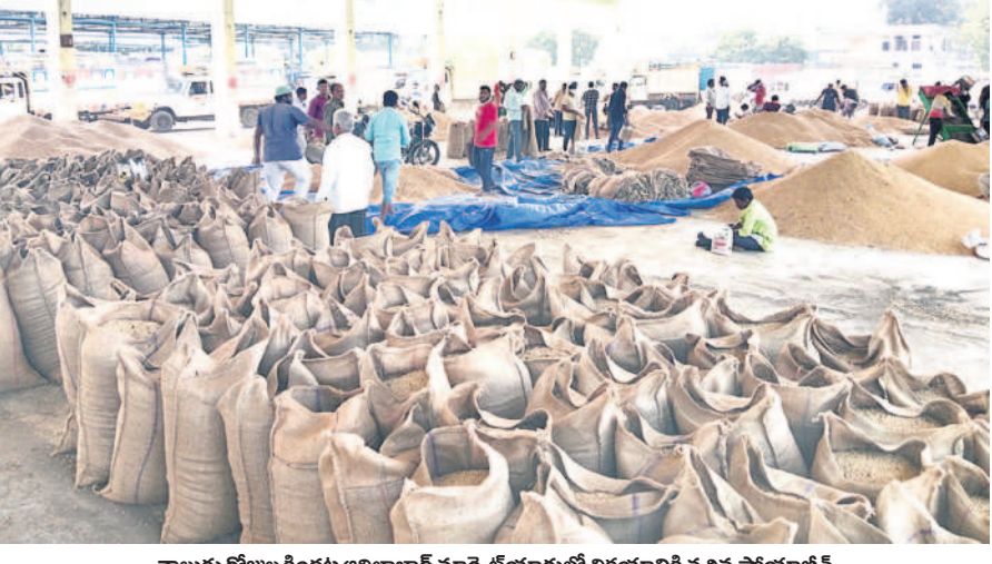
నాలుగు రోజుల కిందట అదిలాబాద్ మార్కెట్ యార్డులో విక్రయానికి వచ్చిన సోయాబీన్