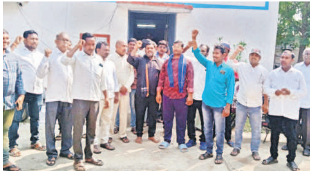
ఎంపీడివో క్షమాపణ చెప్పాలని ఆందోళన చేస్తున్న దళిత సంఘం నాయకులు