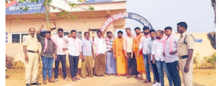
నాగారం పోలీస్ స్టేషన్ వద్ద అరెస్టు అయిన బీఆర్ఎస్ నాయకులు