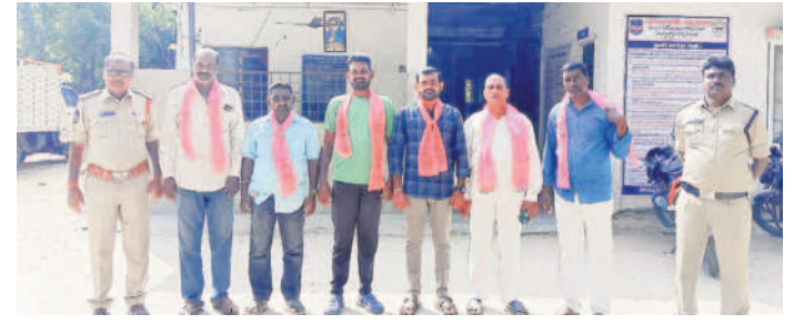
తుంగతుర్తిలో బీఆర్ఎస్ నాయకులను అరెస్టు చేసిన పోలీసులు