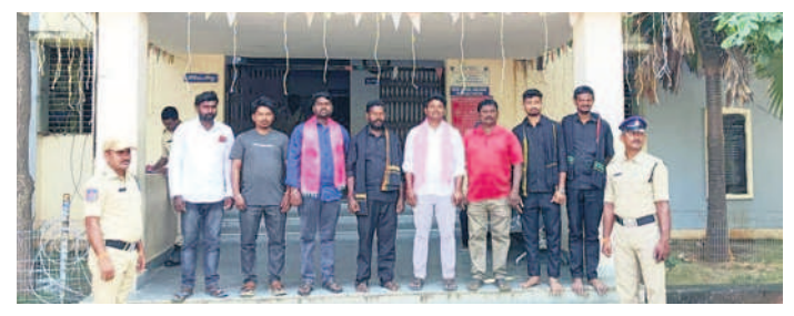
పూజార్దనగర్ లో బీఆర్ఎస్ నాయకులను అరెస్టు చేసిన పోలీసులు