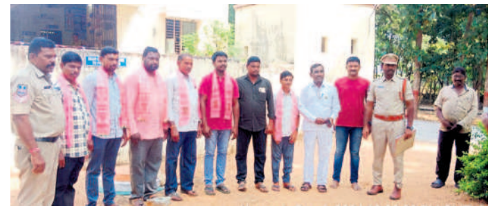
వెన్నపహాడీ పోలీస్ స్టేషన్లో బీఆర్ఎస్ నాయకులు