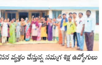
గండేపల్లి: నిరసన వ్యక్తం చేస్తున్న సమగ్ర శిక్ష ఉద్యోగులు

కోదాడ రూరల్, డిసెంబర్ 6 : తమ సమస్యలు పరిష్కరించాలని కోరుతూ సమగ్ర శిక్ష ఉద్యోగులు శుక్రవారం మండల కేంద్రం వద్ద నిరసన చేపట్టారు.