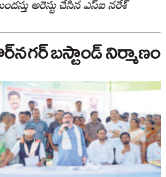
పూజారినగర్: సమావేశంలో మాట్లాడుతున్న మంత్రి పాన్వం ప్రభాకర్

పూజారినగర్, డిసెంబర్ 6 : అత్యాధునిక పద్ధతుల్లో పూజారినగర్ బస్టాండ్ నిర్మాణం చేపడతామని రాష్ట్ర రవాణా శాఖ మంత్రి పాన్వం ప్రభాకర్ అన్నారు.