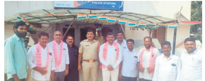
గండేపల్లిలో బీఆర్ఎస్ నాయకులను ముందస్తు అరెస్టు చేసిన ఎన్కే నరేష్