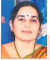
నెల్లూరు రమాదేవి రచయిత్రి