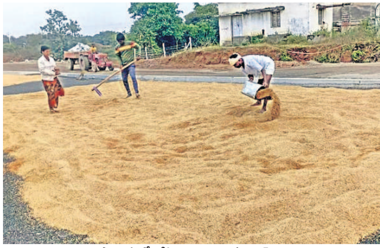
అప్పాయిపల్లిలో తడిసిన ధాన్యాన్ని చూపుతున్న రైతులు