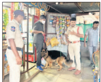
నార్కోటిక్ డాగ్స్ తో చేర్యాల తనిఖీలు నిర్వహిస్తున్న ఎస్సై నిరతే హెచ్చరించారు.

చేర్యాల, డిసెంబర్ 8 : గంజాయి ఇతర మత్తు పదార్థాలు, డ్రగ్స్ నివారణకు ఆదివారం ఎస్సై నిరతే అధ్యక్షతన తనిఖీలు చేపట్టారు. పట్టణంలో పాటు మండలంలోని చుంచనకోటలో కిరాణి షాపులు, పానీ డబ్బాకు తనిఖీలు చేపట్టారు. ప్రదేశాల్లో డాగ్ స్క్వాడ్ తో పాటు పీసీలు అకస్మిక తనిఖీలు నిర్వహించారు. ఈ సందర్భంగా ఎస్సై మాట్లాడుతూ గంజాయి ఇతర మత్తు పదార్థాల బారిన పడకుండా తల్లిదండ్రులు పిల్లలపై ప్రత్యేక నిఘా పెట్టాలని కోరారు. గంజాయి ఇతర మత్తు పదార్థాలు కలిగి ఉన్నారా, రవాణ చేసినారా వారిపై కేసులు నమోదు చేస్తామని హెచ్చరించారు.