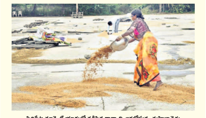
సిద్దిపేట మార్కెట్ యార్డులో తడిసిన ధాన్యాన్ని ఆరబోస్తున్న మహిళా రైతు

భారత్ విద్యార్థి ఫెడరేషన్ ఎన్ఎఫ్ఐ సిద్దిపేట పట్టణ కమిటీ అధ్యక్షుడు నిర్వహించిన సమావేశంలో వారు మాట్లాడారు. వెంటనే విద్యాశాఖ అధికారులు తనిఖీలు చేసి పర్యవేక్షణ ఉండాలని, పాఠశాల నడుపున్న కార్పొరేట్, ప్రైవేట్ విద్యాసంస్థల్ని సీజ్ చేయాలన్నారు.