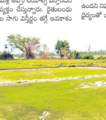
హుస్సాబాద్ పట్టణ శివారులో నారు పోసుకున్న రైతు

ఈ ఏడాది 2024-25లో హుస్సాబాద్ డివిజన్ లో 65,692 ఎకరాల్లో పంటల సాగు అవుతుందని వ్యవసాయ అధికారులు అంచనా వేశారు. ఇందులో వరి 49,050 ఎకరాల్లో సాగు కానుండగా మొక్కజొన్న 14,878 ఎకరాలు, వేరుశనగ 237 ఎకరాలు, పొద్దుతిరుగుడు 1,192 ఎకరాలు, ఇతర