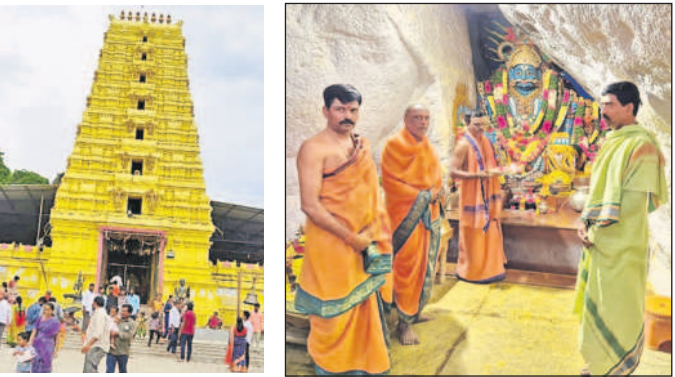
గోపురం వద్ద భక్తులు, ఆలయంలో పూజలు నిర్వహిస్తున్న అర్చకులు

చేర్యాల, డిసెంబర్ 8 : కొమరవెల్లి మల్లన్న ఆలయంలో భక్తుల సందడిగా హరించింది. ప్రతి ఆదివారం రాష్ట్రంలోని వివిధ ప్రాంతాలకు చెందిన భక్తులు పెద్ద సంఖ్యలో మల్లన్న క్షేత్రానికి తరలివచ్చి మొక్కులు తీర్చుకున్నారు. కొమరవెల్లి క్షేత్రానికి 10 వేల మంది భక్తులు వచ్చి మొక్కులు తీర్చుకున్నట్లు ఆంధ్ర కనో అలారి బాలా జియో తెలిపారు. అధిష్టాలు, పట్టణం, అర్చన, ప్రత్యేక పూజలు, ఒడి బియ్యం, కేక ఖండన, గంగగేరం చెట్టు వద్ద ముడుపులు