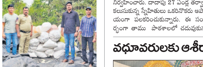
వర్తమాణ్ లో రేషన్ బియ్యం పట్టుకున్న ట్యాంక్ ఫోర్స్ పోలీసులు