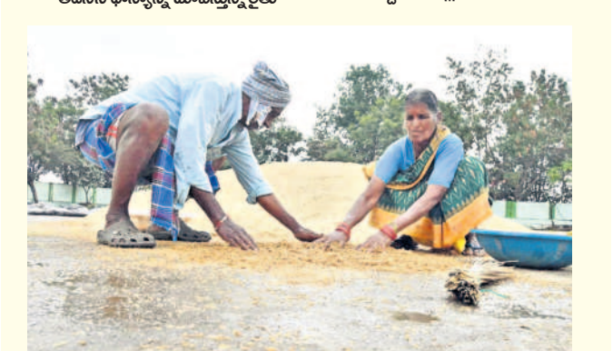
సిద్దిపేట మార్కెట్ యార్డులో తడిసిన ధాన్యాన్ని ఎత్తుతున్న రైతులు

సిద్దిపేట జిల్లాలో శనివారం అర్ధరాత్రి వలచోట్ల వర్షం కురిసింది. దీంతో సిద్దిపేట మార్కెట్ యార్డులో ధాన్యం తడిసి ముద్దయ్యింది. అధికారులు కచ్చపడి పంట పండించి ధాన్యాన్ని మార్కెట్లో తీసుకొచ్చాక.. ప్రభుత్వం కొనడంలో ఆలస్యమవుతున్నందు రైతులు వాపోతున్నారు. ఇప్పటికైనా ప్రభుత్వం త్వరగా ధాన్యాన్ని కొని రైతులను ఆదుకోవాలని కోరుతున్నారు. - షాన్ షాలోరాఫర్, సిద్దిపేట జిల్లా (డిసెంబర్, 8)