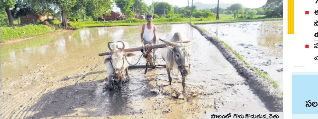
పొలంలో గిద్దు కొడుకున్న రైతు

హుస్సాబాద్, డిసెంబర్ 8 : వానకాల పంట కోతలు పూర్తయ్యాయి. ఇక యాసంగి సాగుకు రైతులందరూ సన్నద్ధమవుతున్నారు. హుస్సాబాద్ వ్యవసాయ డివిజన్ పరిధిలోని హుస్సాబాద్, అక్కన్నపేట, కోహడ, బెజ్జంకి మండలాల్లో యాసంగి పంట సాగుకు రైతులు నారు మడులు దున్ని నారు పోసి నాలు వేసి వరకు తీసుకోవాల్సిన సన్నపక్షణ చర్యలు, ఆ తర్వాత రావాల్సిన ఎరువులు తదితర అంశాలపై ఎప్పటికప్పుడు రైతులు వ్యవసాయ అధికారులు సలహాలు సలహాలు తీసుకోవాలి. అప్పుడే పంట దిగుబడులు అధికంగా వస్తాయి. యాసంగిలో ఎక్కువ వీడియోలు వచ్చే అవకాశం ఉన్నందున అధికారులను సంప్రదిస్తే తగిన ఎరువులను సమీక్షించాలి. రైతు వేదీకల్లో జరిగే అవకాశం సదస్సులకు హాజరై పంటసాగులో మెళకువలు నేర్చుకోవాలి. వానకాల పంట కోసిన అనంతరం వరికొయ్యలను తగ్గరించుకోకూడాలి పొలంలోనే దాన్ని మురుగిడితే భూమిలోనే పోవకూడాలి ఉంటాయి. -శ్రీనివాస్, అసెంబ్లీ రైల్వే అధికారి (హుస్సాబాద్)