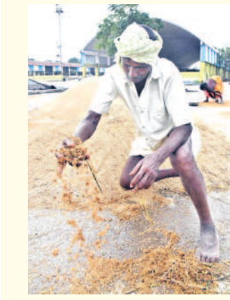
తడిసిన ధాన్యాన్ని చూపిస్తున్న రైతు

సిద్దిపేట జిల్లాలో శనివారం అర్ధరాత్రి వలచోట్ల వర్షం కురిసింది. దీంతో సిద్దిపేట మార్కెట్ యార్డులో ధాన్యం తడిసి ముద్దయ్యింది. అధికారులు కచ్చపడి పంట పండించి ధాన్యాన్ని మార్కెట్లో తీసుకొచ్చాక.. ప్రభుత్వం కొనడంలో ఆలస్యమవుతున్నందు రైతులు వాపోతున్నారు. ఇప్పటికైనా ప్రభుత్వం త్వరగా ధాన్యాన్ని కొని రైతులను ఆదుకోవాలని కోరుతున్నారు. - షాన్ షాలోరాఫర్, సిద్దిపేట జిల్లా (డిసెంబర్, 8)