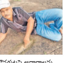
దొంగుట్టపై ఆధారాలను చూపుతున్న రెడ్డి రెడ్డి కేరెడ్డి

కింద ఓ మానవులు ఇక్కడ రాతి పనిమట్లను తయారు చేసుకునేవారని, వ్యవసాయం చేసేవారని తెలుస్తుందని చెప్పారు. ఆలయం వెనుక భాగంలో స్థలంభూ శివలింగం, తొలిన వామన గుంటలు, చాళుక్యుల నాటి వివరాలను సూచించే గ్రాఫ్లు ఉన్నాయని, ఆధారాలను తెలిపే వివరాలను అందుబాటులో ఉంచితే ఆలయ చారిత్రక విలువ రెండంతలు పెంచుతుంటుందని తెలిపారు.