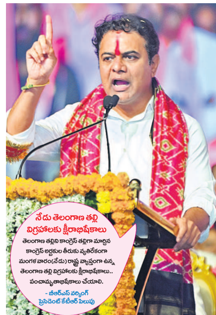
నేడు తెలంగాణ తల్లి విగ్రహాలకు క్షీరాభిషేకాలు తెలంగాణ తల్లిని కాంగ్రెస్ తర్జిమా మాల్దిన కాంగ్రెస్ అల్లకల తీరుకు వ్యతిరేకంగా మంగళవారం(నేడు) రాష్ట్ర వ్యాప్తంగా ఉన్న తెలంగాణ తల్లి విగ్రహాలకు క్షీరాభిషేకాలు.. పంచామృతాభిషేకాలు చేయాలి. - బిఆర్ఎస్ వర్కింగ్ ప్రెసిడెంట్ కేటీఆర్ పిలుపు