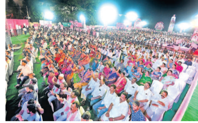
సభకు హాజరైన బిఆర్ఎస్ శ్రేణులు

మార్కులు తగ్గితే చర్యల్..! సిటీబ్యూరో, డిసెంబర్ 9 (నమస్తే తెలంగాణ) : హైదరాబాద్ లోని ఎమ్మార్వో కార్యాలయాల్లో సేవలు ఏ విధంగా అందుతున్నాయి? నిర్ణీత సమయంలోపు సంబంధిత డ్రువర్లు తాము అప్రమత్తంగా ఉన్నారా? వెండింగ్లో దరఖాస్తులకు కారణాలు? ఇలా తదితర అంశాలపై ఉన్న వివరాలు సేకరించి సడరు కార్యాలయాలకు డిప్యూటీ కలెక్టర్లకు మార్కులు ఇస్తున్నారు. ఆ మార్కులు ఆధారంగా సిబ్బందిపై చర్యలు తీసుకోవచ్చు. హైదరాబాద్ కలెక్టర్ అధికారులను డిప్యూటీ కలెక్టర్లకు వారానికి మూడు ఎమ్మార్వో కార్యాలయాలను తనిఖీ చేసి వివరాలు సేకరిస్తారు. ఆ వివరాల ఆధారంగా కలెక్టర్లకు నివేదిక ఇస్తున్నారు. పలు సేవల జాబితాను సారించి పద మార్కులుగా నిర్ణయించి.. కార్యాలయాల పరిస్థితిని పరీక్షించి మార్కులు వేస్తున్నారు. ఇందులో 80కి తక్కువగా ఉంటే సడరు అధికారులపై చర్యలు తీసుకోవచ్చు. కార్యాలయానికి వస్తున్న ప్రజల ఆభిప్రాయాలను సైతం పరిగణనలోకి తీసుకుంటున్నామని ఓ అధికారి తెలిపారు.