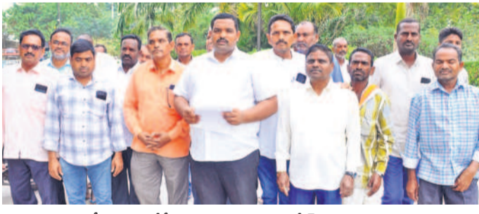
ప్రజావాణిలో ఫిర్యాదు చేసేందుకు జగిత్యాల కలెక్టరేట్ కు వెళ్లిన మోరపల్లి రైతులు