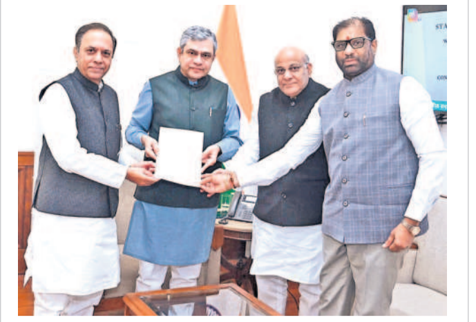
రైల్వే మంత్రి అశ్వినీ వైష్ణవ్ కు వినతిపత్రం అందజేస్తున్న టిఆర్ఎస్ పార్లమెంటులో పార్టీ నేత సురేష్ రెడ్డి, ఎంపీలు దీవకొండ దామోదరరావు, వల్లరాజు రవిచంద్ర

చావనైనా చస్తానని భూమి మాత్రం ఇయ్యను. అప్పులు చేసి పొట్టి పెట్టుకున్నాం. ఇంకో ఎకరంన్నరలో పూల తోట వేశాం. ఈ మాత్రం భూమి కూడా రోడ్డుతో పోతే ఉంది. భూమి సర్వే కూడా మాకు తెలుసుకొన్నాం చేసింది. మాకు అధికారులు సమాచారం ఇవ్వలేదు. భూమి పోతే నావే గి. మేం పొలాన్ని సమ్మర్కొని బతుకుతున్నాం. పాలం పోతే మా బతుకులు ఎట్లు? ప్రభుత్వం వెంటనే రోడ్డు వేయడం ఆపాలి.