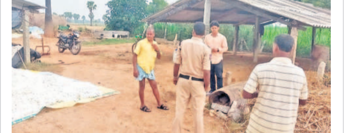
యాదాద్రి భువనగిరి జిల్లా వోట్లపల్లి మున్సిపాలిటీ పరిధిలోని తంగడపల్లిలో సోమవారం జైల్లో అర్ భూసేకరణలో భాగంగా పట్టుకున్న సర్వే చేసేందుకు వచ్చిన అధికారులను రైతులు అడ్డుకున్నారు. జీవనోపాధి పొందుతున్న భూములు పోతే ఎట్లు బతుకులని వారు అధికారుల ఎదుట వాపోయారు. - వోట్లపల్లి

చావనైనా చస్తానని భూమి మాత్రం ఇయ్యను. అప్పులు చేసి పొట్టి పెట్టుకున్నాం. ఇంకో ఎకరంన్నరలో పూల తోట వేశాం. ఈ మాత్రం భూమి కూడా రోడ్డుతో పోతే ఉంది. భూమి సర్వే కూడా మాకు తెలుసుకొన్నాం చేసింది. మాకు అధికారులు సమాచారం ఇవ్వలేదు. భూమి పోతే నావే గి. మేం పొలాన్ని సమ్మర్కొని బతుకుతున్నాం. పాలం పోతే మా బతుకులు ఎట్లు? ప్రభుత్వం వెంటనే రోడ్డు వేయడం ఆపాలి.