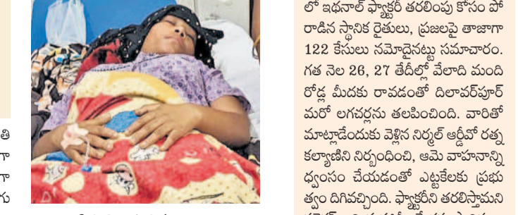
బిత్తిక పొందుతున్న విద్యార్థిని

● 2లక్షల మాఫీ అమలు చేయాలి ● రాష్ట్ర రైతాంగం సదస్సులో వక్తలు విక్రమవల్లి, డిసెంబర్ 9: రాష్ట్రంలో 40శాతం మందికి రుణమాఫీ చేసి మిగతా రైతులను రేవంత్ సర్కారు నిండా ముంచిందని వక్తలు విమర్శించారు. రాష్ట్ర ప్రభుత్వం ప్రకటించిన రూ.2లక్షల రుణమాఫీని వెంటనే అమలు చేయాలని డిమాండ్ చేశారు. వైపు కూలి పోలీసులు సీఎం రేవంత్ రైతులను ముంచినారని విమలకృష్ణ పోల్స్ సాయం రంగ సమస్యల పరిష్కారం కోసం సుందరయ్య విజ్ఞాన కేంద్రంలో సోమవారం రాష్ట్ర సదస్సు నిర్వహించారు. సదస్సులో