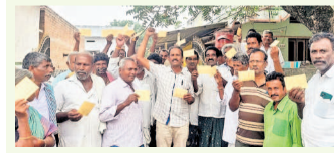
ఖమ్మం జిల్లా ముదిగొండ మండలం బిరుమలలో పోస్టుకార్యాలయ రైతులు, రైతు సంఘం నాయకులు

ఖిలా వరంగల్/మహబూబాబాద్ రూరల్, డిసెంబర్ 9: రుణమాఫీ ఇంకెప్పుడు చేస్తారు టూ రైతులు ఆగ్రహం వ్యక్తం చేస్తున్నారు. ఎన్ని జాబితాలు విడుదల చేసినా అందులో తమ పేర్లు లేవంటూ వారు మండి పడుతున్నారు. ఓ వైపు రుణమాఫీ పూర్తయిందని ప్రభుత్వం చెబుతున్నా మాఫీ కాని రైతులు ఇంకా చాలామంది ఉన్నారని వారు అంటున్నారు. రుణమాఫీ కాని రైతులను సోమవారం వరంగల్, మహబూబాబాద్ కలెక్టరేట్ నిరసన తెలిపారు. వరంగల్ జిల్లా నెక్కోలాండ మండలం అలంకానిపేట, మహబూబాబాద్ మండలం మాడపాపరం, కురవీ మండలం బంజారాకండా రైతులు ఆయా జిల్లాల కలెక్టరేట్ల ఎదుట దర్శాకు దిగారు. ఆరులైన తమకు రుణమాఫీ చేయకుండా కాంగ్రెస్ ప్రభుత్వం కాలయాపన చేస్తున్నదని విమర్శించారు. నెక్కోండ మండలం ఐపోలీలో 1500 మంది రైతుల ఖాతాలు ఉండగా అందులో 800 మందికి మాత్రమే రుణమాఫీ జరిగిందని వారు పేర్కొన్నారు. మిగతా 900 మందికి అధికారుల