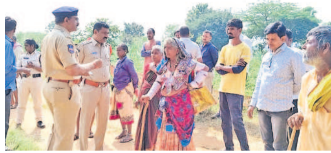
పోలీసులతో మాట్లాడుతున్న మహిళా రైతులు

కందుకూరు, డిసెంబర్ 9 (నమస్తే తెలంగాణ): కాంగ్రెస్ ప్రభుత్వం రైతులపై మరో పడుగు వేసేందుకు సిద్ధమైంది. లగపల్లె రైతుల పోరాటం మరచకముందే అన్నదాతల సర్కారు మరో పడుగు వేస్తుంది. ఫోర్టైంటికి 330 ఫీల్డ్ రోడ్డుకు సర్కారు ప్రణాళిక వేసింది. ఫోర్టైంటికి 330 ఫీల్డ్ రోడ్డుకు సర్కారు ప్రణాళిక వేసింది. ఫోర్టైంటికి 330 ఫీల్డ్ రోడ్డుకు సర్కారు ప్రణాళిక వేసింది. ఫోర్టైంటికి 330 ఫీల్డ్ రోడ్డుకు సర్కారు ప్రణాళిక వేసింది.