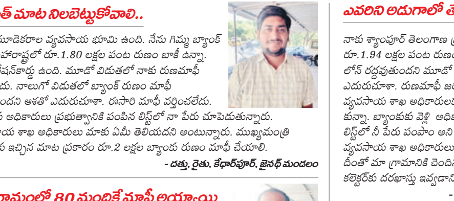
రుణమాఫీ పల్లం చేయాలని ప్రజావాణికి పోబిట్టిన రైతుల మండలం శ్యాంపూర్ రైతులు

ఆదిలాబాద్ (నమస్తే తెలంగాణ) /నిర్మల్ జిల్లాలో డిసెంబర్ 9 : ఆరు గ్యారంటీడ్ భాగంగా కాంగ్రెస్ ప్రభుత్వం మాఫీ చేస్తున్న రూ.2 లక్షల రుణమాఫీ మాఫీ చేస్తారని ప్రజావాణికి పోబిట్టిన రైతులే నిరసన తెలుపారు. కలెక్టర్ కార్యాలయం ఎదుట ధర్నా నిర్వహించారు. ఈ సందర్భంగా నాయకులు మాట్లాడుతూ.. రైతులందరికీ రూ. 2 లక్షల రుణమాఫీ చేయాలన్నారు. రైతులకు తక్షణం రుణం అందజేయాలన్నారు. యా సంగి వంటలకు సంబంధించి ఎకరానికి 15000 రూపాయలు ఇవ్వాలని కోరారు.