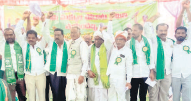
తొమ్మిది డిమాండ్లను తీర్చాలని చేసిన నివాదాలు చేస్తున్న ఆదివాసి పెద్దలు