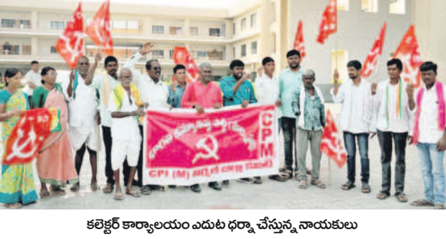
కలెక్టర్ కార్యాలయం ఎదుట ధర్నా చేస్తున్న నాయకులు

నిర్మల్, డిసెంబర్ 9 : ప్రభుత్వం భాగ్యం కొనుగోలు కేంద్రాల్లో డోపిడీ జరుగుతుందన్నారు. 40 కేజీల నుంచి 42 నుంచి 43 కేజీల వరకు తూకం చేసే డోపిడీ చేస్తున్నారన్నారు. అంతకుముందు ఆదనపు కలెక్టర్ కు వివరణ కోరడం ఉండటంతో ఆదిలాబాద్, నిర్మల్ జిల్లాల్లో నిర్వహించిన ప్రజావాణికి పోబిట్టిన రైతులే నిరసన తెలుపారు. కలెక్టర్ కార్యాలయం ఎదుట ధర్నా నిర్వహించారు. ఈ సందర్భంగా నాయకులు మాట్లాడుతూ.. రైతులందరికీ రూ. 2 లక్షల రుణమాఫీ చేయాలన్నారు. రైతులకు తక్షణం రుణం అందజేయాలన్నారు. యా సంగి వంటలకు సంబంధించి ఎకరానికి 15000 రూపాయలు ఇవ్వాలని కోరారు.