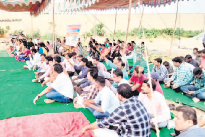
మంచర్యాల కలెక్టరేట్ ఎదుట లోలీ ఢిల్లీలో సమగ్ర శిక్ష ఉద్యోగులు