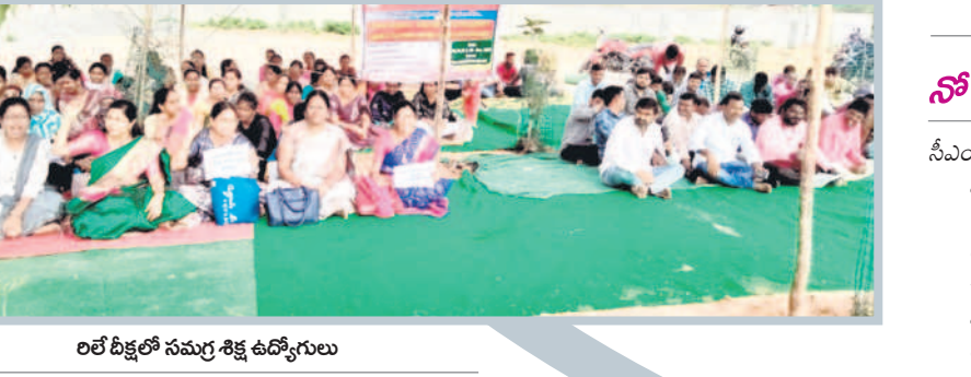
రిలే ఢిల్లీలో సమగ్ర శిక్ష ఉద్యోగులు

మంచర్యాల, డిసెంబర్ 9 (నమస్తే తెలంగాణ ప్రతినిధి) : 'విద్యా శాఖ-సమగ్ర శిక్షలో కౌంట్రీ కలెక్టర్ పదవీదు వదులు నిర్వహించాలి ఉద్యోగులను రెగ్యులరైజ్ చేయాలనే డిమాండ్ తో సీబీ (మంగళవారం) నుంచి ఉద్యోగులు సమ్మేళనం చేస్తున్నారు. ఎన్నికలకు ముందు ఇచ్చిన హామీ మేరకు ముఖ్యమంత్రి రేవంత్ రెడ్డి రెగ్యులరైజ్ చేసి, వెంటనే పే-స్కేల్ అమలు చేయాలని డిమాండ్ చేశారు. ఈ మేరకు గడిచిన నాలుగు రోజులు రాష్ట్రవ్యాప్తంగా సమగ్ర శిక్ష ఉద్యోగుల కలెక్టరేట్ కార్యాలయం ఎదుట రిలే ఢిల్లీలు చేస్తున్నారు. సమస్యల పరిష్కారానికి వ్యతిరేకంగా ముందంజు కార్యాలయం ప్రకటించి, ఈ నెల 10వ తేదీన సమ్మేళనం వెళ్లమని చెప్పిస్తున్నారని ఉద్యోగులు ఆగ్రహం వ్యక్తం చేస్తున్నారు. సమగ్ర శిక్ష ఉద్యోగులు వాపోతున్నారు. కాంగ్రెస్ ప్రభుత్వం అధికారంలోకి వచ్చిన వెంటనే మీ అందరినీ రెగ్యులర్ చేస్తామని, గతేడాది నవంబర్ 18వ తేదీన సీఎం రేవంత్ రెడ్డి ఉద్యోగులకు హామీ ఇచ్చారు. కానీ.. ప్రభుత్వం ఏర్పడి ఏడాది అవుతున్నా ఇచ్చిన హామీని అమలు చేయకపోవడంతో తీవ్ర నిరాశకు గురయ్యారు. ప్రభుత్వం మేం కలసుకుంటే మిమ్మల్ని ఎంపీని తిరుగుతూ ఉంటుంది. అన్నింటికంటే ముఖ్యంగా పదే తరగతి విద్యార్థులకు పనికికల సీడ్లను చేస్తున్న నేపథ్యంలో ఉద్యోగుల సమ్మేళనం విద్యార్థులకు మేరకం చేయాలని కోరుకుంటున్నామని కోరారు.