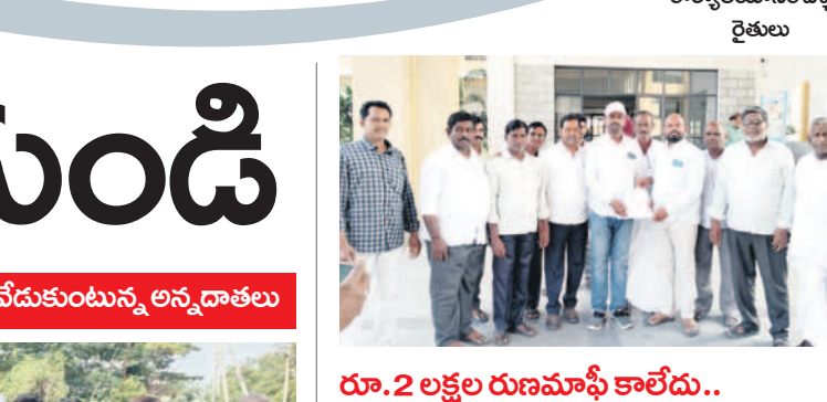
రూ.2 లక్షల రుణమాఫీ కాలేదు..

ప్రభుత్వం రూ.2 లక్షల రుణం ఉన్న రైతులకు మాఫీ చేస్తామని చెప్పి చేయలేదని వైసీపీ మండలంలోని వాల్తేలూ గ్రామానికి చెందిన రైతులు సోమవారం నిర్మల్ కలెక్టర్ కార్యాలయానికి వచ్చారు. ప్రభుత్వం ఎన్నికల ముందు రూ.2 లక్షల వరకు రుణమాఫీ చేస్తామని ప్రకటించిందని, ఇటీవల మాఫీ చేసిన జాబితాలో తమకు మాఫీ కాలేదని గ్రామానికి చెందిన రైతులు కార్యాలయానికి వచ్చి ప్రజావాణిలో ఫిర్యాదు చేశారు. కేసీఆర్ ప్రభుత్వం ఉన్నప్పుడు రుణమాఫీ అయిందన్నారు. కానీ.. రూ.2 లక్షల వైసీపీ ఉన్న రుణం ఉన్న రైతులకు మాఫీ కాలేదన్నారు. గ్రామంలో 150 మందికి మాఫీ కాలేదన్నారు. ప్రభుత్వం నుంచి రుణమాఫీ చేయాలని రైతులు కోరారు.