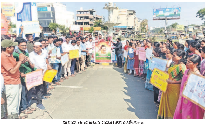
నిరసన తెలుపుతున్న సమగ్ర శిక్ష ఉద్యోగులు