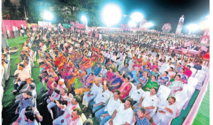
సభకు హాజరైన బీఆర్ఎస్ శ్రేణులు