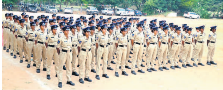
నల్లగొండ జిల్లాకు కొత్తగా వచ్చి కానిస్టేబుళ్లు

అధికారుల సూచనలు, సలహాలు తీసుకుంటూ పనిచేయాలన్నారు. కార్యక్రమంలో సిబ్బంది పాల్గొన్నారు. బాధితులనుంచి దరఖాస్తుల స్వీకరణ జిల్లా పోలీసు కార్యాలయంలో సోమవారం నిర్వహించిన గ్రీన్ ఫీల్డ్ జిల్లాలోని వివిధ ప్రాంతాల నుంచి పచ్చిన బాధితుల నుంచి ఎస్సీ శరత్చంద్ర పవార్ వినతిపత్రాలు స్వీకరించారు. మొత్తం 85 ఫిర్యాదులు రాగా వాటిని సలబంధి పోలీస్ స్టేషన్ల అధికారులకు బదిలీ చేసి బాధితులకు న్యాయం చేయాలని ఆదేశించారు.