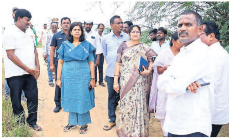
కనగల్లో జూనియర్ కాలేజీ నిర్మాణానికి స్థలాన్ని పరిశీలిస్తున్న కలెక్టర్ ఇలా త్రిపాఠి