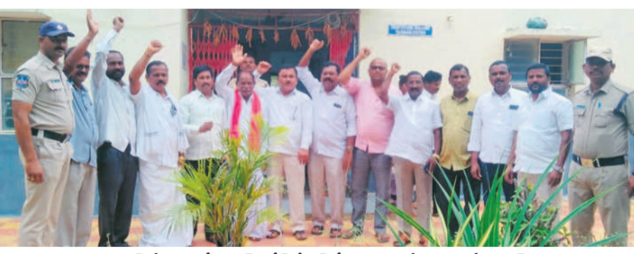
అరెస్ట్ చేయడంతో కనగల్ పోలీస్ స్టేషన్లో నివాదాలు చేస్తున్న మాజీ సర్పంచ్ ల