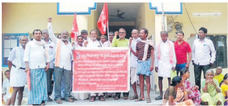
గుర్రంపాడులో తాసీల్దార్ కార్యాలయం వద్ద ధర్మా చేస్తున్న రైతులు