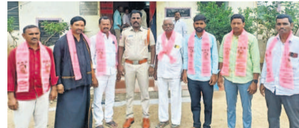
తిరుమలగిరిలో మాజీ సర్పంచ్ లను ముందస్తు అరెస్ట్ చేసిన పోలీసులు

నల్లగొండ ప్రతినది, డిసెంబర్ 9 (నమస్తే తెలంగాణ) : పెండింగ్ బిల్లులు చెల్లించాలని కోరుతూ చలో హైదరాబాద్ కు వెళ్తున్న మాజీ సర్పంచులను ఎక్కడిక్కడ పోలీసులు అరెస్టు చేశారు. ఉమ్మడి నల్లగొండ జిల్లావ్యాప్తంగా దాదాపు అన్ని మండలాల్లో తరలివెళ్లకుండా ప్రభుత్వం ముందు జాగ్రత్త చర్యలు చేపట్టింది. తెల్లవారుజాము నుంచే పోలీసులు కట్టుదిట్టమైన చర్యలు చేపట్టి నిర్బంధించారు. నల్లగొండ, మిర్యాలగూడ, కనగల్, చండూరు, మాడ్లపల్లి, నాంపల్లి, పెద్దపూర, త్రిపురారం, నిడమనూర్, దేవరకొండ, హాళియా, నకిరేకల్, కట్టంగూరు, ముసుగోడు తదితర మండలాల్లో మాజీ సర్పంచులను అరెస్టు చేశారు. చలో హైదరాబాద్ వెళ్లిన నిర్బంధించారు. సూర్యాపేట జిల్లా బిమ్మల, పెన్సపూడ్, నేరేడుపల్లె, గండిపల్లి, మాతె, బిలుకూరు, తిరుమలగిరి, తుంగతుర్తి, నాగారం, మద్దిరాల, నూత