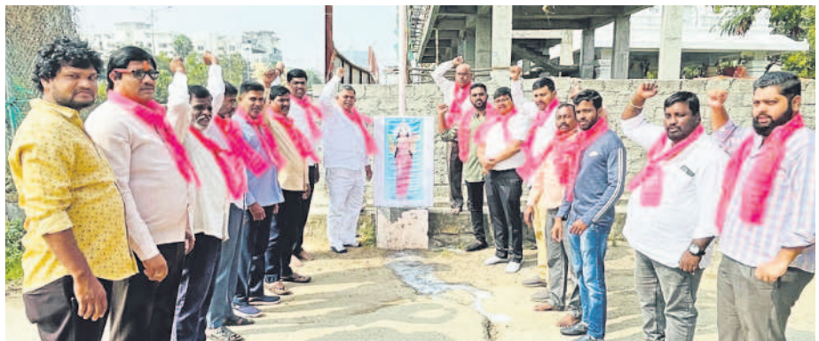
భాజగూడలో తెలంగాణ తల్లి చిత్రపటానికి క్షీరాభిషేకం చేసే నాచాదానిస్తున్న మాజీ కార్మిక కార్యకర్తల సామితి సభ్యులు, బీఆర్‌ఎస్ శ్రేణులు