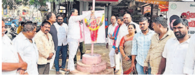
బండ్లగూడ చౌరస్తా వద్ద తెలుగు తల్లి చిత్ర పటానికి క్షీరాభిషేకం చేస్తున్న బీఆర్ఎస్ నాయకులు

పాఠశాలకు ముందుగా.. విద్యార్థులు వచ్చినా.. అనుమతి లేదు. పాఠశాలకు చెప్పినా.. ఓ డోంట్ కేరీ. బయోసీసీ పాఠశాల హామీల తీరుపై గుస్సా. ఆందోళన చేసిన విద్యార్థులు, తల్లిదండ్రులు. శంభూబాద్ రూరల్, డిసెంబర్ 10 : అలసానా పాఠశాలకు వచ్చారని విద్యార్థులను లోపలికి అనుమతించకపోవడంతో విద్యార్థులు వారి తల్లిదండ్రులు ఆందోళనకు దిగిన ఘటన మంగళవారం శంభూబాద్ మండలంలో చోటు చేసుకున్నది. విద్యార్థులు వారి తల్లిదండ్రులు తెలిపిన వివరాల ప్రకారం శంభూబాద్ మండలంలోని అమ్మప్ప రెవెన్యూ పరిధిలో ఒయసీసీ పాఠశాల ఉన్నది. పాఠశాల సమయం 8:30నిమిషాలు ఉండగా 8:20 నిమిషాలకు పాఠశాల గోల్కు తాళం వేశారు. దీంతో విద్యార్థులు గేటు బయటే ఉన్నారు. విద్యార్థులు వారి తల్లిదండ్రులను సమయం అవ్వడంతో విద్యార్థులలో పాటు వారి తల్లిదండ్రులు శంభూబాద్-పాపాద్ రోడ్డుపై ఆందోళనకు దిగారు. శంభూబాద్ ట్రాఫిక్ పోలీసులు చేరుకొని విద్యార్థులను వారి తల్లిదండ్రులను సమయం అవ్వడంతో విద్యార్థులను లోపలికి అనుమతిస్తే వెళ్లిపోతామని విద్యార్థుల తల్లిదండ్రులు చెప్పినా పాఠశాల హామీల ఉపాదేశం