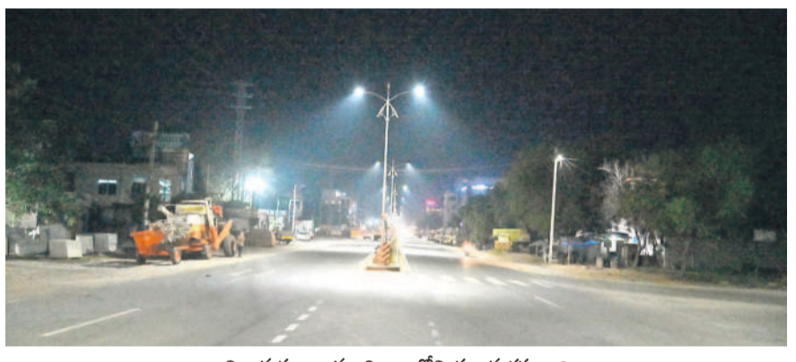
నిర్మాణవ్యూహం మంచిర్యాలలోని ప్రధాన రహదారి

- సిర్యూర్(యా)/మంచిర్యాల స్టాఫ్ ఫోటోగ్రాఫర్, డిసెంబర్ 13