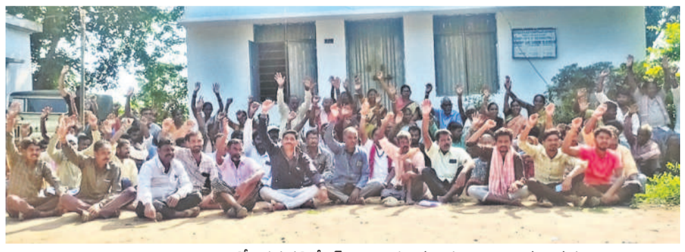
నెన్నెలలోని కుష్మపల్లి రేంజ్ కార్యాలయం ముందు బైరాయిలిన గ్రామస్థులు