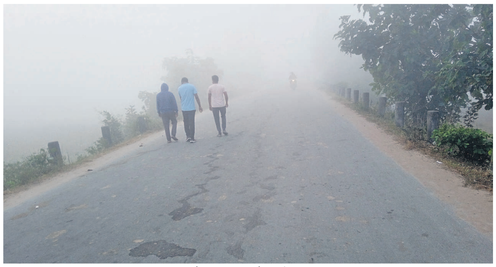
జిల్లాలో కమ్ముతున్న పొగ మంచులో వాకింగ్ చేస్తున్న యువకులు

కుమ్రం భీం ఆసిఫాబాద్, మంచిర్యాల జిల్లాలపై చలి పంజా విసిరింది. ఒక్కసారిగా ఉష్ణోగ్రతలు పడిపోగా ప్రజానీకం గజగజ వణికిపోయింది. గురువారం సిర్యూర్(యా)లో కనిష్ఠంగా 7.3 డిగ్రీలు నమోదు కాగా, గడ్డకట్టుకుపోయే పరిస్థితి తలెత్తింది. ఆయాచోట్ల ఉదయం ఎనిమిది గంటల దాకా పొగమంచు తొలగకపోవడంతో రోడ్లు కనిపించక వాహనాల డ్రైవర్లు ఇబ్బంది పడాల్సి వచ్చింది. ఇక వివిధ పనులపై బయటకు వెళ్లిన వారంతా చీకటి వడకముందే ఇళ్లకు చేరుకోగా, రోడ్లపై సందడి తగ్గింది. ప్రధానంగా ఏజెన్సీ ప్రాంతాల్లో ఉదయం.. సాయంత్రం చిన్నా పెద్దలంతా నెగడ్లు వేసుకొని చలి మంటలు కాగుతూ కనిపించారు.