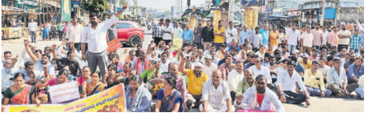
మేట్లపల్లిలో జాతీయ రహదారిపై రాస్తారోకో చేస్తున్న గ్రామస్థులు

• వెల్లుల్ల గ్రామస్థల డిమాండ్ • మేట్లపల్లి వరకు పాదయాత్ర.. రాస్తారోకో