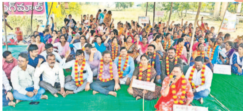
నిద్రలోనే ఆపాతి మండలం రగుడు జంక్షన్ వద్ద రైల్వేస్టేషన్ పార్ట్లోని సమగ్ర శిక్ష ఉద్యోగులు