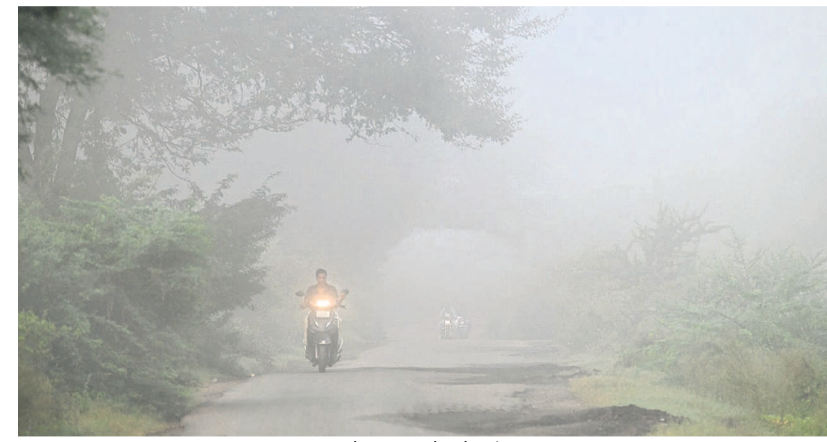
ఆదిలాబాద్ శివారుల్లో పొగమంచు కమ్మకోవడంతో లైట్లు వేసుకుని వెళ్తున్న వాహనదారులు

ఆదిలాబాద్ జిల్లావాసులను వణికిస్తున్న చలి • ఈ యేడాది ఇప్పటివరకు ఇదే అత్యల్ప టెంపరేచర్