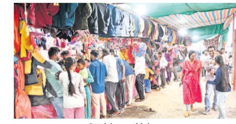
స్వెట్టర్ దుకాణాల వద్ద ప్రజలు

రక్షణ చర్యలు రోజురోజుకు పెరుగుతున్న చలి కారణంగా ప్రజలు ఇబ్బందులు పడుతున్నారు. ఉపశమనం కోసం రక్షణ చర్యలు తీసుకుంటున్నారు. స్వెట్టర్లు, ముష్లర్లు, ముంకి క్యాపీలు ధరిస్తున్నారు. ఉదయం, సాయంత్రం వేళల్లో ప్రధాన రోడ్లతోపాటు వీధుల్లో జన సంచారం కనపడడం లేదు. జాతీయ రహదారి-44పై మంచు కారణంగా వాహనదారులు లైట్లు వేసుకుని వెళ్తున్నారు. పల్లెల్లో ప్రజలు చలి మంటలు వేసుకుని మంటలు కాగుతున్నారు. పట్టణాల్లో రూం హీటర్లను వినియోగిస్తున్నారు. వేడి కోసం ఛాయీలు తాగుతుండడంతో టీ దుకాణాల వద్ద జనసంచారం కనపడుతున్నది. చలికి తోడు ఈ దుకాణాలు వీస్తుండడంతో చలి తీవ్రత అధికంగా ఉంటుంది.