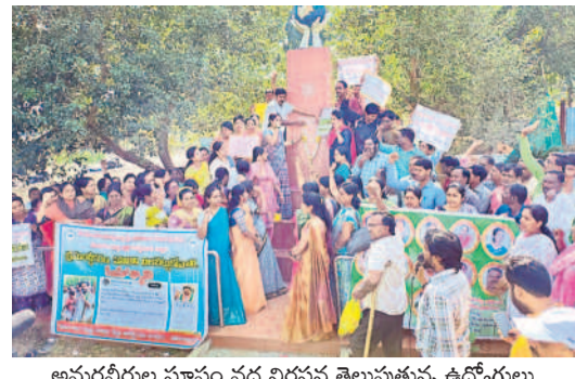
అమరవీరుల స్మారకం వద్ద నిరసన తెలుపుతున్న ఉద్యోగులు