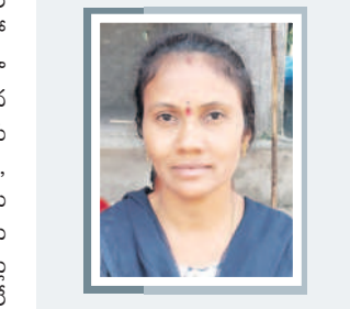
మాకు న్యాయం చేయాలి