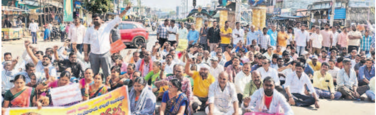
మెట్పల్లిలో జాతీయ రహదారిపై రాస్ట్రోకో చేస్తున్న గ్రామస్థలు

• వెల్లుల్ల గ్రామస్థల డిమాండ్ • మెట్పల్లి వరకు పాదయాత్ర.. రాస్ట్రోకో