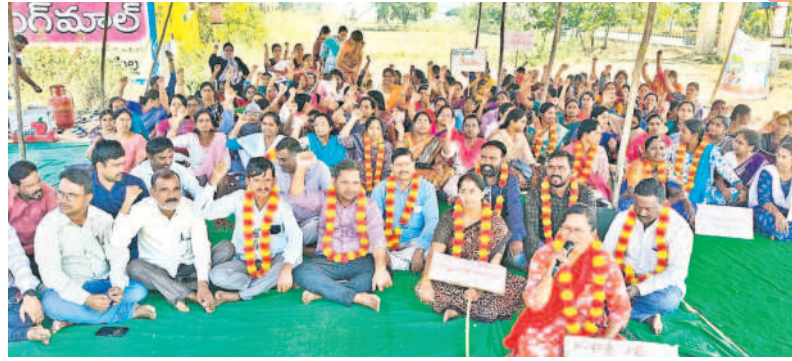
సిరిసిల్ల అర్ధం మండలం రంగుడు జంక్షన్ వద్ద రైల్వేస్టేషన్లో పాల్గొన్న సమగ్ర శిక్ష ఉద్యోగులు