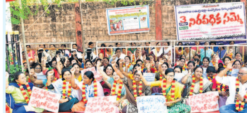
కరీంనగర్ కలెక్టరేట్ ఎదుట డిక్షన్ సమగ్ర శిక్ష ఉద్యోగులు