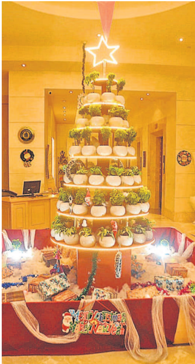
గచ్చిబౌలిలోని రాడిసన్ హోటల్ 5వ క్రిస్మస్ ట్రీ సంబురాలు శుక్రవారం ప్రారంభమయ్యాయి. ఇందులో భాగంగా విమాతృ తరహాలో క్రిస్మస్ ట్రీని ఏర్పాటు చేశారు. పలు రకాల మొక్కలతో కూడిన కుడిలతో పర్యావరణ హిత క్రిస్మస్ ట్రీని ప్రత్యేకంగా రూపొందించి...విద్యుత్తు పాలతో అలంకరించడంతో ప్రత్యేక ఆకర్షణగా నిలిచింది.

నగరానికి సుదూరంగా, గతంలో పాల్గా సిటీ నిర్మాణానికి ప్రతిపాదించిన ముప్పైదేళ్లను ఆనుకుని ఫోర్ట్ సిటీకి కాంగ్రెస్ ప్రభుత్వం తలపెట్టింది. కాగితాలకే పరిమితమైన ఈ ప్రాంతానికి రెండో దశలోనే మెట్రో విస్తరిస్తామని హామీ ఇచ్చింది. ఎయిర్ పోర్టు నుంచి ఫోర్ట్ సిటీకి చేరుకునేలా ఎబివెటిడీ మెట్రోతో డిజైన్లు ఖరారు చేసింది. కానీ ఎప్పుడో ప్రతిపాదించిన ఈబీఆర్ టీఎస్ పక్కన పెట్టింది. ప్రస్తుతం ఈ ప్రాజెక్టు విషయంలో ఎలాంటి కదలికలు లేవు. ఈబీఆర్ టీఎస్ పై హెచ్ఎంసీపి చేసిన అధ్యయనాలను కూడా పరిశీలించకుండానే... మెట్రో విస్తరణ పేరిట ప్రాజెక్టుకు మరగంజీం పాడారు. భవిష్యత్లో కూడా మెట్రో రవాణా సదుపాయం లేని ప్రాంతాల్లో ఈబీఆర్ టీఎస్ పక్కన పెట్టాలనే ఆలోచన లేదని తెలిసింది.