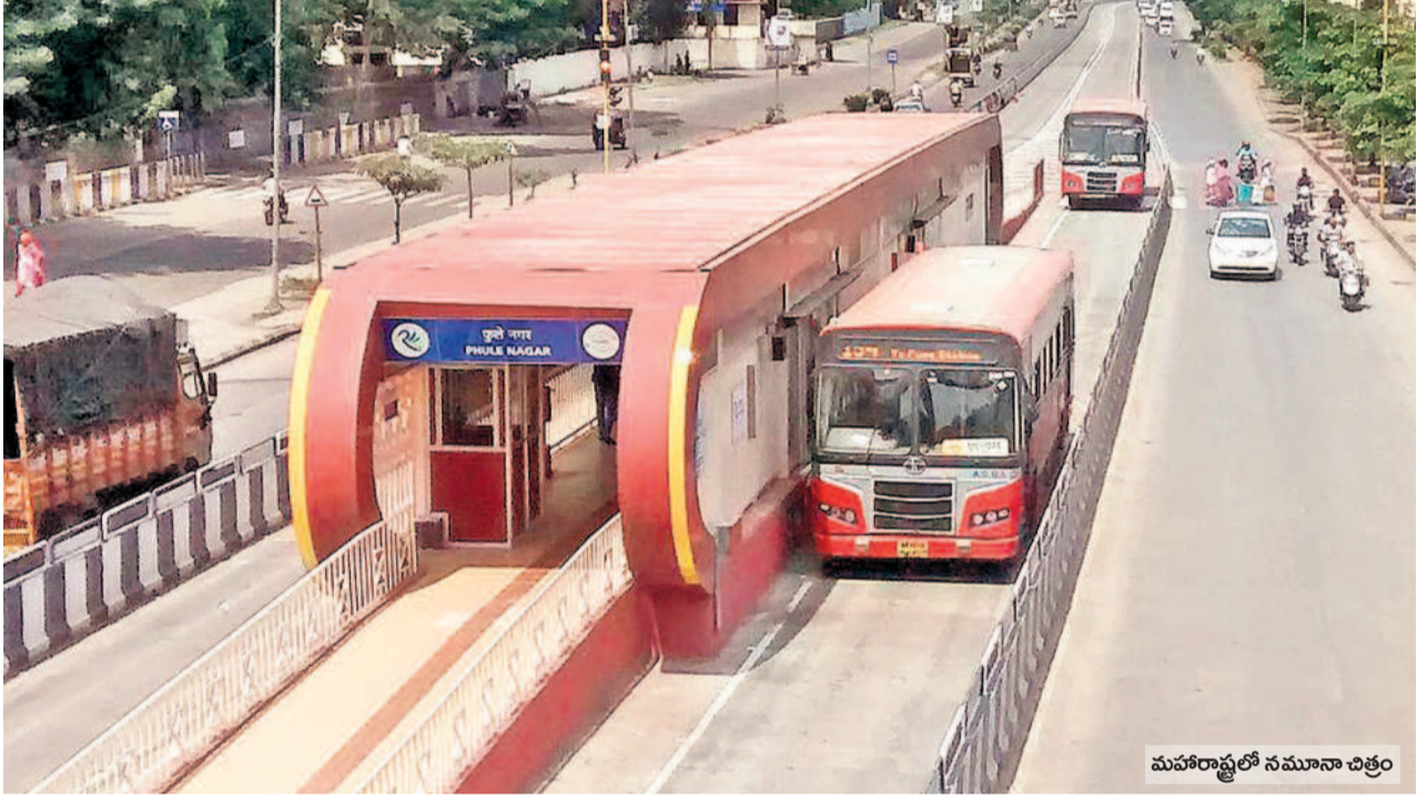
మహారాష్ట్రలో నమూనా చిత్రం

మెట్రో విస్తరణకు అనుకూలం లేని, జనసందారం ఎక్కువగా ఉండే ప్రాంతాల్లో ఎబివెటిడీ బస్ ర్యాపిడ్ ట్రాన్స్ పోర్టులను నిర్మించాలని హైదరాబాద్ అర్బన్ మెట్రోపాలిటన్ ట్రాన్స్ పోర్టు అథారిటీ ప్రత్యేక నివేదిక రూపొందించింది. ఇందులో భాగంగా నగరంలో మొదట దశలో దాదాపు 70 కిలోమీటర్ల మేర మెట్రో అందుబాటులోకి వచ్చింది. కానీ ఎప్పుడో నిర్మించాల్సిన బీఆర్ టీఎస్ ప్రాజెక్టును కాంగ్రెస్ సర్కారు కాగితాలకే పరిమితం చేసింది. గతంలో బీఆర్ టీఎస్ ప్రభుత్వం ఈ ప్రాజెక్టు విషయంలో ఉన్నత స్థాయి సమీక్ష సమావేశం ద్వారా రూ.3 వేల కోట్ల అంచనా వ్యయంతో తొలి దశలో 22 కిలోమీటర్ల మేర ఈబీఆర్ టీఎస్ నిర్మించాలని ప్రతిపాదించింది. దీనికి అనుగుణంగా భూసేకరణ, ప్రాజెక్టు డిజైన్లు, రూట్ మ్యాప్, మెట్రో అనుసంధానం వంటి అంశాలతో పకడ్బందీ ప్రణాళికలను సిద్ధం చేసింది. కాంగ్రెస్ ప్రభుత్వం పాత ప్రణాళికలను పక్కనపెట్టింది.. మెట్రో విస్తరణ పేరిట ఫోర్ట్ సిటీకి మళ్ళించింది.