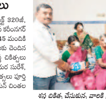
శస్త్ర చికిత్స చేసుకున్న వారికి ట్రైడ్ అండజేస్తున్న ప్రతినిధులు