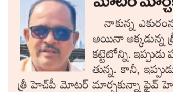
మోటార్ మార్కెట్ ను యుద్ధం అందుకు కట్టాలి

నాలుగు నెలలు కలిపి మొత్తం రూ.480 చెల్లించాలని హాకుం జారీ చేస్తున్నారు. ఆ సరైతే మొదటి వాయిదా కింద రూ.300, రెండో వాయిదా రూ. 180 చెల్లించాలని సూచిస్తున్నారు. ఇప్పటికే వసూలు కూడా ప్రారంభించారు. మరోవైపు శ్రీ హెచ్ఎస్ కే కే కే కే