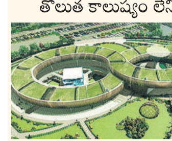
తొలుత కాలవలను లేని పరిశ్రమలకు అనుమతి ఫార్మాసిటీ స్థానంలో జనరల్ ఇండస్ట్రియల్ ఫార్మాను ఏర్పాటు చేసేందుకు బీజేపి ఇప్పటికే రేపుతున్న కూడా సిద్ధం చేసింది. అక్కడ ముందుగా ఫార్మా పరిశ్రమలను కాకుండా సాధారణ పరిశ్రమలతోపాటు కాలవలను ఏర్పాటు చేసేందుకు అనుమతి ఇవ్వాలని ఆ పార్టీ అభ్యంతరం లేని ఘోషించింది.

ప్రజల నుంచి తీవ్ర ప్రతిఘటన ఎదురవడంతో రావడంతో ప్రభుత్వం వెనక్కి తగ్గింది. అక్కడ ఫార్మా విలేజ్ స్థానంలో ఇండస్ట్రియల్ కారిడార్ ను ఏర్పాటు చేస్తున్నట్లు ప్రకటించింది. జహీరాబాద్ లో సైకెట్ ఫార్మా విలేజ్ పట్ల ప్రజల నుంచి తీవ్ర వ్యతిరేకత వ్యక్తమవుతుండటంతో అక్కడ లగచర్ల రైతుల తిరుగుబాటు తరహా ఘటనలు తలెత్తకుండా చూసేందుకు అధికారులు క్షేత్రస్థాయిలో రైతుల