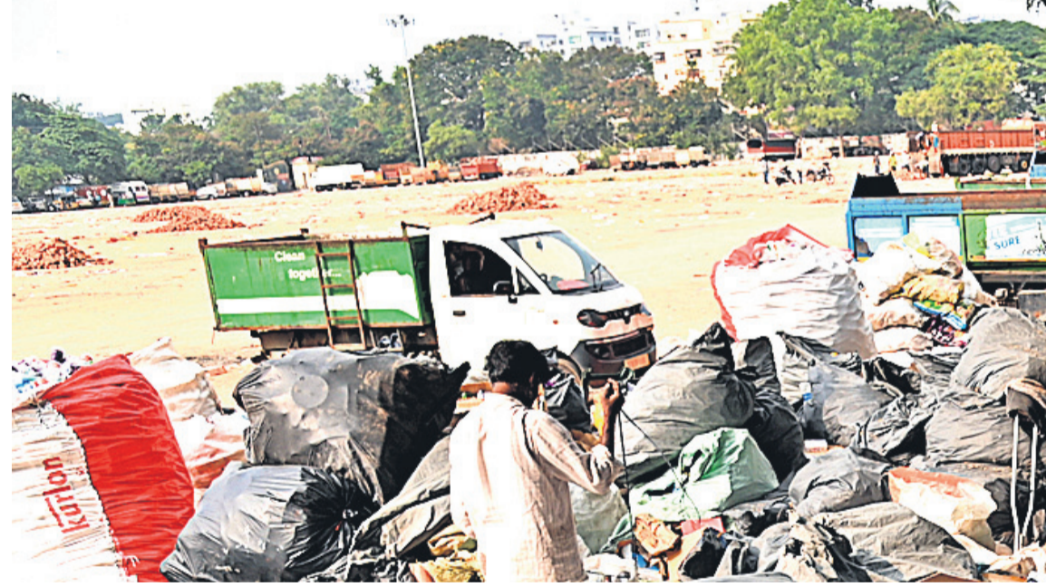
చెత్తదంపింగ్ యార్డుల మాలిన ఇందిరాపార్క్ వద్ద ఉన్న ఎస్టీఆర్ క్రీడామైదానం

సీటీబియార్, డిసెంబర్ 14 (నమస్తే తెలంగాణ) : డ్రగ్స్ బారిన పడి విద్యార్థులు, యువత తమ జీవితాలను నాశనం చేసుకుంటున్నారు. మాదకద్రవ్యాల బారిన పడితే వాటి నుంచి బయటపడటానికి ఇబ్బందులు ఎదుర్కొంటున్నారు. ఈ నేపథ్యంలో మాదక ద్రవ్యాల నియంత్రణకు జిల్లా విద్యాశాఖ చర్యలు చేపట్టింది. హైదరాబాద్లో ప్రతీ సర్కారు పాఠశాలల్లో విద్యార్థుల్లో చైతన్యం నింపడానికి ప్రత్యేక అవగాహన కార్యక్రమాలకు శ్రీకారం చుట్టింది. అందులో భాగంగా తొలుత కొన్ని పాఠశాలలను ఎంపిక చేసి డ్రగ్స్ పై అవగాహన కల్పిస్తారు. ఇందుకోసం సైకాలజిస్టుల సేవలు కూడా వినియోగించుకోనున్నారు. డ్రగ్స్ వినియోగిస్తే ఎలాంటి నష్టాలు, అనారోగ్య సమస్యలు కలుగుతాయో వివరించనున్నారు. మండల వారీగా పాఠశాలల్లో డ్రగ్స్ అవేరెన్స్ యాక్టివిటీ చేపట్టబోతున్నట్లు అధికారులు తెలిపారు. విద్యార్థుల బంగారు భవిష్యత్లో టీచర్ల బాధ్యత ఎంతైతే ఉండే.. తల్లిదండ్రుల కూడా ఆదేశ పత్రం అని విద్యార్థులను తీర్చిదిద్దడంలో పేరెంట్స్ పాత్రకు కూడా వారికి అవగాహన కల్పిస్తుమని పేర్కొన్నారు.