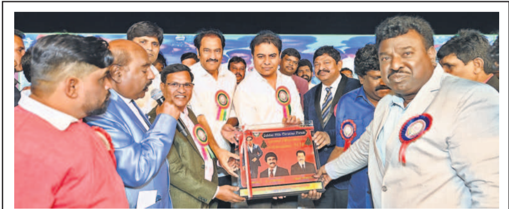
జీఎంఎస్ వర్కర్స్ ప్రెసిడెంట్ కేటీఆర్ కు జ్ఞాపికను అందజేస్తున్న జూబిహెచ్ డిప్యూటీ సీనియర్ ఫోటో సభ్యులు