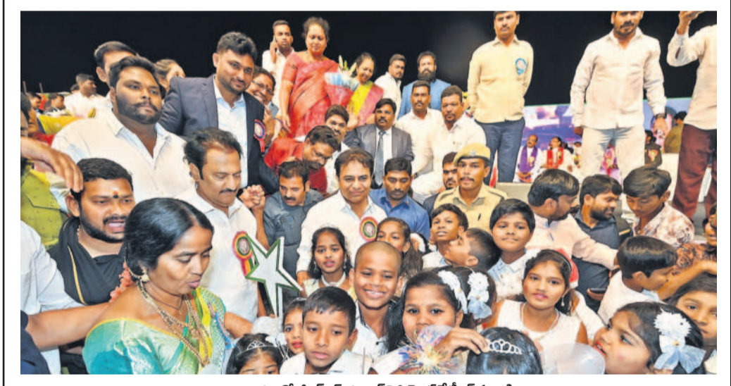
చిన్నారితో జీఆర్ఎస్ వర్కర్స్ ప్రెసిడెంట్ కేటీఆర్ సందడి