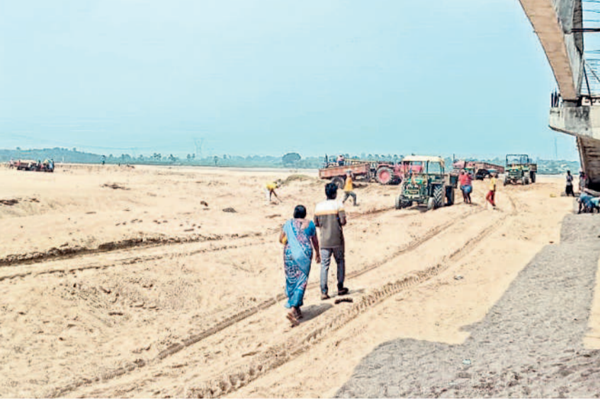
మానేరు వాగు ఇసుకను ట్రాక్టర్ లోడ్ చేస్తున్న కూలీలు