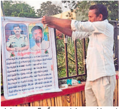
మహబూబాబాద్ ఎస్సీ, న్యాయమూర్తి చిత్రపటాలకు క్షీరాభిషేకం చేస్తున్న బాధితులకు వెంకన్న