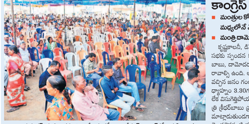
జయశంకర్ భూపాలపల్లి జిల్లా కేంద్రంలోని అంబేద్కర్ సెంటర్ లో నిర్వహించిన మండ్రుల సభలో జనాలు లేక ఖాళీగా దర్శనమిస్తున్న కుర్చీలు

లోకి తీసుకువచ్చింది. ఈ ఆస్పత్రిలో శనివారం మండ్రులు అదనపు భవన నిర్మాణ పనులకు శంకుస్థాపన చేశారు. అలాగే అంబేద్కర్ చౌక్ నుంచి కేటీఆర్-2 ఇంక్లైన్ వరకు రోడ్డు విస్తరణ, సెంట్రల్ ట్రైలింగ్, డ్రైనేజీ నిర్మాణాలకు బీఆర్ఎస్ ప్రభుత్వం రూ.10 కోట్లు మంజూరు చేయగా పనులు గతంలోనే ప్రారంభమయ్యాయి. అయితే కాంగ్రెస్ ప్రభుత్వం అధికారంలోకి రాగానే పనులు నిలిపివేసింది. సుమారు పది నెలల తర్వాత గతంలో పనిచేస్తున్న కాంగ్రాక్టర్ ను తొలగించి మళ్ళీ మరో కాంగ్రాక్టర్ కు పనులు అప్పగించి శనివారం మండ్రులతో శంకుస్థాపన చేయించడం స్థానికంగా చర్చనీయాంశమైంది. ప్రభుత్వం మారితే పనులు ఆపివేస్తారా? మరో కాంగ్రాక్టర్ కు అప్పగిస్తారా? ప్రారంభించిన పనులకి మళ్ళీ శంకుస్థాపనలు చేస్తారా? అని స్థానిక ప్రజలు ప్రశ్నిస్తున్నారు.