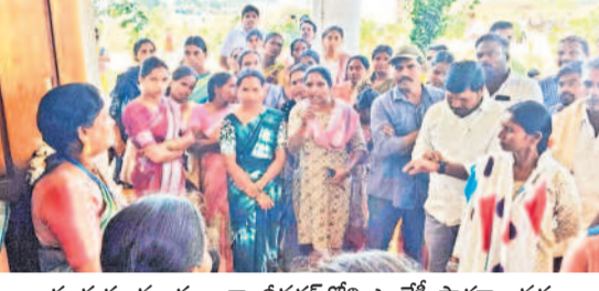
గణపూర్ మండలం గాంధీనగర్ లోని అంజేపీ పాఠశాల వద్ద ఆందోళన చేస్తున్న విద్యార్థినుల తల్లిదండ్రులు

గణపూర్, డిసెంబర్ 14 : తమ పిల్లలతో మాట్లాడనివ్వాలని తల్లిదండ్రులు శనివారం జయశంకర్ భూపాలపల్లి జిల్లా గణపూర్ మండలం గాంధీనగర్ లోని మహాశాఖ జ్యోతిషాపాలలో వసతి గృహం ఎదుట ఆందోళన చేపట్టారు. నిర్ణయించిన సమాధానం చెప్పిన ప్రిన్సిపాల్ పై ఆగ్రహం వ్యక్తం చేశారు. వివరాల కోసం వెళ్తే.. రెండో శనివారం కావడంతో తల్లిదండ్రులు తమ పిల్లలను మానుకుంటున్న జ్యోతిషాపాలలో వసతి గృహానికి వచ్చారు. కానీ, ప్రిన్సిపాల్ సన్నద్ధం, సిబ్బంది మాట్లాడడానికి వారికి అనుమతి ఇవ్వలేదు. దీంతో తల్లిదండ్రులు ప్రిన్సిపాల్ వద్దకు వెళ్లి బతిమిలాడినా కనికరం చేశారు. దీంతో అనుమతి కి గుర్తిన తల్లిదండ్రులు ప్రిన్సిపాల్ పై ఆగ్రహం వ్యక్తం చేశారు. ఉదయం 9 గంటలకే తల్లిదండ్రులు హాస్టల్ కు చేరుకున్నారు. ఇదే సమయంలో జిల్లా సు ప్రారంభించేందుకు మండ్రులు అక్కడికి రావాల్సి ఉంది.