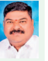
సామంత్ బిక్షుపతి గాడ్, కుందపల్లి, బోకుమట్ల

మండలంలో సహజవనరులైన ఇసుక, మొరం దండం విచ్చలవిడిగా సాగుతున్నది. ప్రజలు, కుల సంఘాలు, అధికారులు అడ్డుకుంటున్నా ఫలితం లేదు. అధికారులకు సమాచారం ఇస్తే వారు తమ విధులు నిర్వహించకుండా అక్రమారులు శాసిస్తున్నారు. పట్టణానికి ప్రతి ఒక్కరు ఎమ్మెల్యే పేరు చెప్పి బయటకు వస్తున్నారు. ప్రజా ప్రభుత్వంపై ప్రజలకు నమ్మకం సన్నగిల్లుతున్నది. ఇప్పటికైనా ఎమ్మెల్యే స్వయం ది అక్రమ దండాలకు, అక్రమారులకు చెక్ పెట్టి, అధికారులు తమ పని చేసుకుంటే స్వీచ్ చేస్తామని.