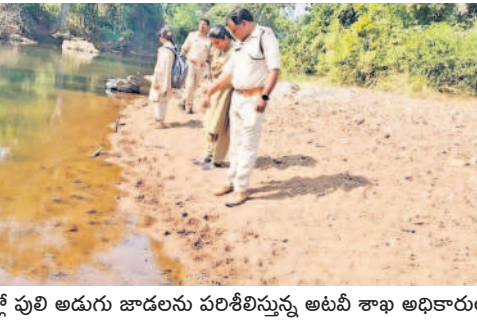
ఆళ్లపల్లి అడవులో పులి అడుగు జాడలను పరిశీలిస్తున్న అటవీ శాఖ అధికారులు