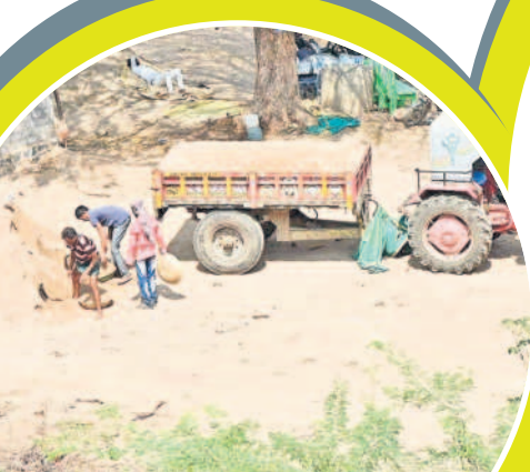
ఖమ్మం రూరల్ మండలం కరుణిగి ఎదుట ఉన్న ప్రాంతంలో అక్రమంగా నిల్వ ఉంచిన ఇసుకను తరలిస్తున్న దృశ్యం

గత కేసీఆర్ ప్రభుత్వం తెచ్చిన మైనింగ్ పాలసీలో భాగంగా జిల్లాలో అక్రమ మైనింగ్ ను నిలువరించేందుకు నాడు జిల్లా అధికార యంత్రాంగం ప్రత్యేక టాన్స్ ఫోర్స్ బృందాలను ఏర్పాటు చేసింది. జిల్లాలో రెవెన్యూ శాఖ నుంచి అదనపు కలెక్టర్ (రెవెన్యూ)/ఖమ్మం, కల్యాణ అడ్మిన్, పోలీస్ శాఖ నుంచి టాన్స్ ఫోర్స్ ఏసీబీ/సీఐ, రవాణా శాఖ నుంచి డీజీవో/ఎంపీఐ, మైనింగ్ అండ్ జియాలజీ శాఖ నుంచి ఆసిస్టెంట్ జియాలజిస్ట్/రాజల్లీ ఇన్స్పెక్టర్ సభ్యులుగా ఉంటూ జిల్లాస్థాయి టాన్స్ ఫోర్స్ బృందాన్ని ఏర్పాటు చేశారు. మండలంలో రెవెన్యూ శాఖ నుంచి తహసీల్దార్, పోలీస్ శాఖ నుంచి ఎస్పీ/ఎస్ఐ, పీఆర్ నుంచి ఎంపీడీవో లతో మండలస్థాయి టాన్స్ ఫోర్స్ బృందాలుగా ఏర్పాటు చేశారు. ఈ బృందాలు మైనింగ్ అక్రమాలపై తనిఖీలు చేసి.. వాటిని నిలువరించి కేసులు నమోదు చేయాలి కన్నప్పటికి ఏడాది కాలంగా కార్యాచరణలోకి దిగిన పాపాన పోలేరు. చివరికి మండలం కూడా సమీక్షించి పరిస్థితి లేదు.