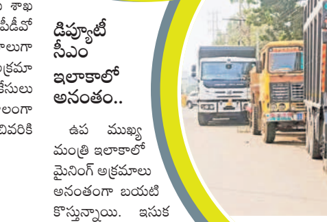
ఖమ్మం అర్బన్ పోలీస్ స్టేషన్ ఎదుట నిలిపి ఉంచిన ఇసుక లాల్లి

నిండుకున్న డీఎంఎఫ్ ఖజానా.. మైనింగ్ అక్రమాలను అదుపు చేయడంలో ప్రభుత్వం విఫలం కావడంతో జిల్లా మినరల్ ఫండ్స్ ట్రస్ట్ ఖాతాలో నిధులు నిండుతున్నాయి. గత కేసీఆర్ ప్రభుత్వంలో ఏడాది సుమారు రూ.200 కోట్ల వరకు నిధులు ఉండేవి. కానీ.. ప్రస్తుత 2023-24లో డీఎంఎఫ్ ఖాతాలో రూ.19 కోట్లు మాత్రమే ఉండడం గమనార్హం. ఇక సీనెరేజీలోనూ కేవలం రూ.92 కోట్ల సమకాలాం. తద్వారా డీఎంఎఫ్ నిధుల ద్వారా జిల్లాలో జరగాల్సిన అభివృద్ధి పనులు కుంటున్నాయి.