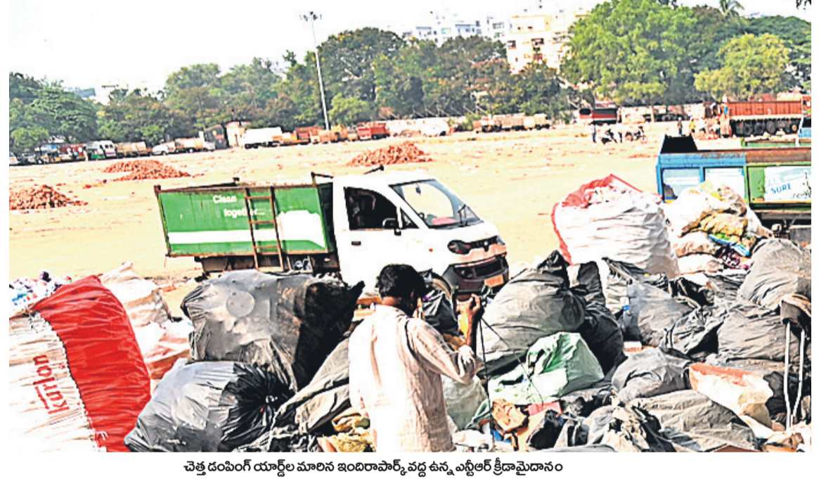
చెత్తదంపింగ్ యార్డుల మాలిన ఇందిరాపార్క్ వద్ద ఉన్న ఎస్టీఆర్ క్రీడా మైదానం

సీటీబియార్, డిసెంబర్ 14 (నమస్తే తెలంగాణ) : డ్రగ్స్ బారిన పడి విద్యార్థులు, యువత తమ జీవితాలను నాశనం చేసుకుంటున్నారు. మాదకద్రవ్యాల బారిన పడితే వారి నుంచి బయటపడటానికి ఇబ్బందులు ఎదుర్కొంటున్నారు. ఈ నేపథ్యంలో మాదక ద్రవ్యాల నియంత్రణకు జిల్లా విద్యాశాఖ చర్యలు చేపట్టింది. హైదరాబాద్లో ప్రతీ సర్కారు పాఠశాలల్లో విద్యార్థుల్లో చైతన్యం నింపడానికి ప్రత్యేక అవగాహన కార్యక్రమాలకు శ్రీకారం చుట్టింది. అందులో భాగంగా తొలుత కొన్ని పాఠశాలలను ఎంపిక చేసి డ్రగ్స్ పై అవగాహన కల్పిస్తారు. ఇందుకోసం సైకాలజిస్టుల సేవలు కూడా వినియోగించుకోనున్నారు. డ్రగ్స్ వినియోగిస్తే ఎలాంటి నష్టాలు, అనారోగ్య సమస్యలు కలుగుతాయో వివరించనున్నారు. మండల వారీగా పాఠశాలల్లో డ్రగ్స్ అవేరెస్ యాక్టివిటీ చేపట్టబోతున్నట్లు అధికారులు తెలిపారు. విద్యార్థుల బంగారు భవిష్యత్లో టీచర్ల బాధ్యత ఎంతైతే ఉండే.. తల్లిదండ్రుల కూడా ఆవేశ పాత్ర అని విద్యార్థులను తీర్చిదిద్దడంలో పేరెంట్స్ పాత్ర కూడా వారికి అవగాహన కల్పిస్తుమని పేర్కొన్నారు.