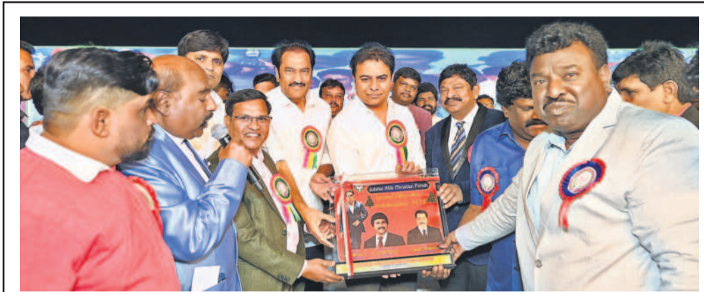
జీఆర్ఎస్ వర్కర్ల పైసెడెంట్ కేటీఆర్ కు జ్ఞాపికను అందజేస్తున్న జూబ్లీహిల్స్ క్రీస్టియన్ ఫోరం సభ్యులు