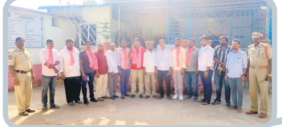
ఉబ్బారెడ్డి పోలీస్ స్టేషన్లో బీఆర్ఎస్ నాయకులు, కార్యకర్తలు

గిరిజన ఎమ్మెల్యే అని చిన్న చూపా.. పార్టీ నాయకులను హెచ్చరించారు. ఎమ్మెల్యే పదవికి గౌరవం ఇవ్వాలని కఠిన పరిణామం ఉండాలని, ఇలా చేసిన వారి విజ్ఞాపక పదలే స్వచ్ఛమైనవి తెలిపారు. పార్టీ నాయకులందరూ శాంతించాలని ఎమ్మెల్యే కోరడంతో వారు ఆందోళన విరమించారు. చివరకు పార్టీ నాయకులందరూ గేటు బయటే ఉండగా, ఎమ్మెల్యే కార్యక్రమానికి హాజరయ్యారు.