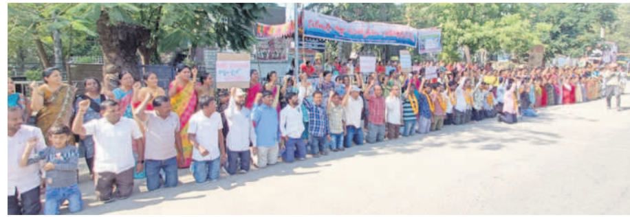
మోకాళ్ళపై కూర్చొని నిరసన తెలుపుతున్న కాంట్రాక్ట్ ఉద్యోగులు

● డిమాండ్లను నెరవేర్చాలని మోకాళ్ళపై కూర్చొని నిరసన ● నిర్మల్లో ఉద్యతంగా కొనసాగుతున్న నిరవధిక సమ్మె