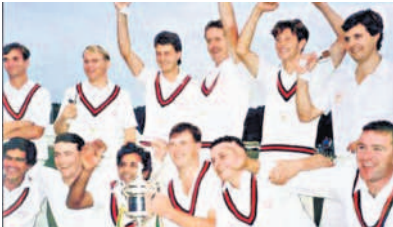
1990లో స్పెన్ విక్టోరియా క్రికెట్ కెప్ గెలిచిన ఆనందంలో..

అవకాశాలను గమనించింది. పాకిస్తాన్ కు తిరిగి వచ్చాక.. తన సోదరులను ఇంగ్లండ్ లోని పరిశ్రమల్లో పనికి వెళ్లమని ప్రోత్సహించింది. తానే ఆర్థిక సహాయం కూడా అందించింది. సోలీ వాళ్ల నాన్న 1954లో ఇంగ్లండ్ ప్రయాణమయ్యాడు. తర్వాత తొమ్మిదేండ్లకు 1963, అక్టోబర్ 14న ఇంగ్లండ్ లో అడుగుపెట్టాడు సోలీ. అప్పుడు తన చేతిలో ఉన్న ఒక ఫౌండ్రీ మాత్రమే! ద్యూస్ బెరీలో ఉన్న తండ్రిని కలిశాడు. పద