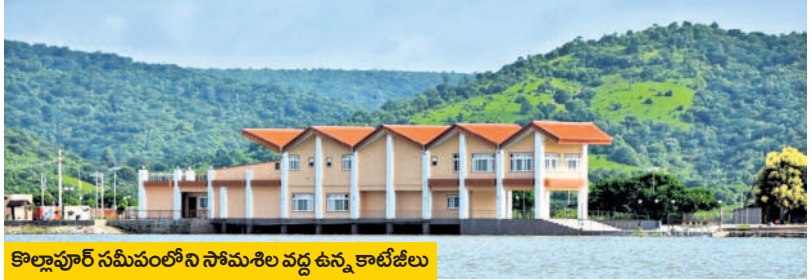
కొల్లాపూర్ సమీపంలోని సోమశిల వద్ద ఉన్న కాటేజీలు

సోమశిల టు శ్రీశైలం లాంచీ ప్రయాణం ఎన్నో అనుభూతులకు కేరాఫ్ గా నిలుస్తుంది. మొత్తం దూరం 120 కిలోమీటర్ల ప్రయాణం పర్యాటక, ఆధ్యాత్మిక కలబోతగా సాగుతుంది. శబ్దాబ్లా కిందట సప్తనదుల చెంతన శైవం వర్ధిల్లింది. ఇక్కడి శైవ ఆలయంలో గంట మోగిన తర్వాతే శక్తి పీఠమైన శ్రీశైలంలో పూజలు ప్రారంభమయ్యేవని కథనం. ఇలా పౌరాణిక ప్రాశస్త్యం కలిగిన సప్తనదుల కూడలి (సోమశిల) నుంచి శ్రీశైలానికి జల విహారం ఆద్యంతం అదృశ్యమే! ఈ ప్రయాణంలో వేప