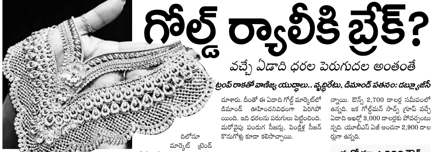
దిలేసూ మార్కెట్ ట్రెండ్ ఇదే రీతిలో ఉండవచ్చునని అభిప్రాయాన్ని 2025 బెటేలుకోలో వ్యక్తం చేసింది.

ఫార్మాసిటీ స్టానంలో జనరల్ ఇండస్ట్రియల్ పార్కును ఏర్పాటు చేసేందుకు టీజీబిఐఐ ఇప్పటికే రేఅప్లను కూడా సిద్ధం చేసింది. అక్కడ ముందుగా ఫార్మా పరిశ్రమలను కాకుండా సాధారణ పరిశ్రమలతో పాటు కాలవ్యం లేని ఆస్కారం లేని ఔషధ కంపెనీలను అనుమతించాలని నిశ్చయించుకున్న తెలిసింది. ఔషధ పరిశ్రమలో పావులేవున్న, బల్బుడ్రగ్స్ తయారీ విభాగాలు ఎంతో లోబకమైనవి. ఇవి కాలవ్యం లేని పరిశ్రమలకు కావడంతో తొలుత రసాయనాల ఫ్యాక్టరీలు ఏర్పాటు చేయాలని, ఆ తర్వాత ఔషధ పరిశ్రమలకు గ్రీన్ సిగ్నల్ ఇవ్వాలని రేవంతుల భావిస్తున్నట్లు సమాచారం. ఇలా చేస్తే రద్దయిన ఫార్మాసిటీ మళ్లీ మనగడలోకి వచ్చే అవకాశం ఉంటుందని చెప్పుచున్నా.