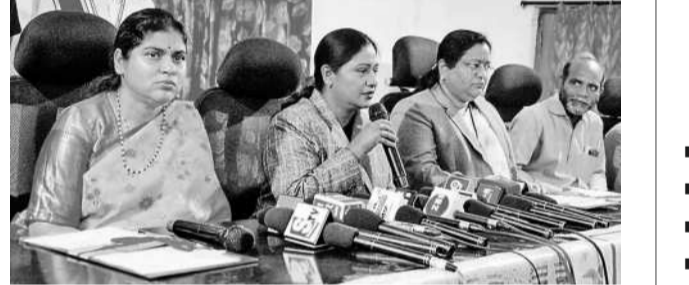
మాట్లాడుతున్న ప్రధాన న్యాయమూర్తులు

దేశీయ డాటా సెంటర్లలోకి అంతర్జాతీయ సంస్థలు భారీగా పెట్టుబడులు పెట్టాయి. వీటిలో సాఫ్ట్వేర్.. ఈ ఏడాది చివరవాటికి 1,600 కంటిక్ట్ ఫండ్ల కూడా భారీగా నిధులుపోషించినట్లు తెలిసింది. టీఎఫ్ఎస్ఐ, టెక్నాలజీ, టెక్నో రంగాల నుంచి డాటా సెంటర్ల డిమాండ్ ఉంటుందని తెలిసింది.