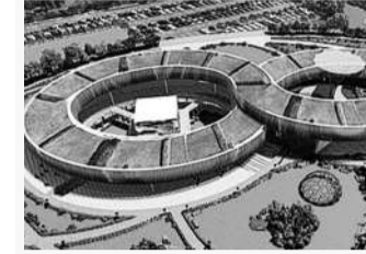
ఫార్మాసిటీ స్టానంలో జనరల్ ఇండస్ట్రియల్ పార్కును ఏర్పాటు చేసేందుకు టీజీబిఐఐ ఇప్పటికే రేఅప్లను కూడా సిద్ధం చేసింది. అక్కడ ముందుగా ఫార్మా పరిశ్రమలను కాకుండా సాధారణ పరిశ్రమలతో పాటు కాలవ్యం లేని ఆస్కారం లేని ఔషధ కంపెనీలను అనుమతించాలని నిశ్చయించుకున్న తెలిసింది. ఔషధ పరిశ్రమలో పావులేవున్న, బల్బుడ్రగ్స్ తయారీ విభాగాలు ఎంతో లోబకమైనవి. ఇవి కాలవ్యం లేని పరిశ్రమలకు కావడంతో తొలుత రసాయనాల ఫ్యాక్టరీలు ఏర్పాటు చేయాలని, ఆ తర్వాత ఔషధ పరిశ్రమలకు గ్రీన్ సిగ్నల్ ఇవ్వాలని రేవంతుల భావిస్తున్నట్లు సమాచారం. ఇలా చేస్తే రద్దయిన ఫార్మాసిటీ మళ్లీ మనగడలోకి వచ్చే అవకాశం ఉంటుందని చెప్పుచున్నా.