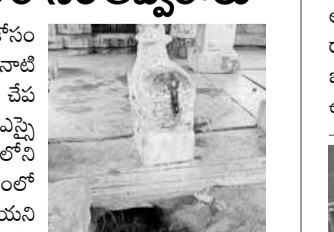
నంది విగ్రహం వెనుక తవ్విన గుంత