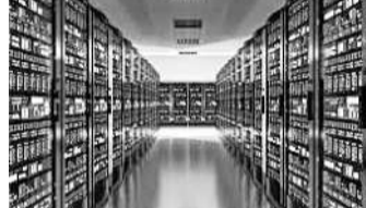
న్యూఢిల్లీ, డిసెంబర్ 14: పెట్టుబడులను ఆకర్షించడంలో డాటా సెంటర్ల యాజమాన్యం తున్నాయి. 2027 వాటికి డాటా సెంటర్ల విభాగంలోకి 100 బిలియన్ డాలర్ల మేర పెట్టుబడులు వచ్చే అవకాశం ఉన్నదని సీటిఆర్ కె అంచనా వేస్తున్నది. అలాగే డాటా సెంటర్ల కెపాసిటీ 2070 మెగావాట్లకు చేరుకుంటుందని తెలిసింది. ప్రస్తుతం 1,255 మెగావాట్ల స్థాయిలో ఉన్న డాటా సెంటర్లలో 400 ఏడాది చివరవాటికి 1,600 మెగావాట్లకు చేరుకుంటుందని తెలిసింది. గడిచిన ఆరేండ్లలో 60 బిలియన్ డాలర్ల పెట్టుబడులను ఆకర్షించిన దేశీయ డాటా సెంటర్ల విభాగం.. వచ్చే మూడేండ్లలో 100 బిలియన్ డాలర్లకు చేరుకోనున్నదని సీటిఆర్ కె సోకా

డాటా సెంటర్ లోకి రెండేండ్లలో 100 బిలియన్ డాలర్లు: సీటిఆర్ కె