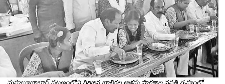
మహబూబాబాద్ పట్టణంలోని గిరిజన బాలికల ఆశ్రమ పాఠశాల వసతి గృహంలో విద్యార్థినులతో కలిసి భోజనం చేస్తున్న ఎమ్మెల్యే తక్కువ రవీందర్ రావు