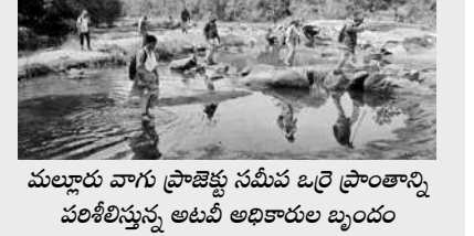
మల్లూరు వాగు ప్రాంతాల్లో సమీప ఒర్రె ప్రాంతాన్ని పరిశీలిస్తున్న అటవీ అధికారుల బృందం