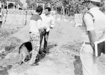
దాగ్ స్కాన్సెడ్ గాలింపు చర్యలు చేపడుతున్న సీబి, ఎన్ఫై