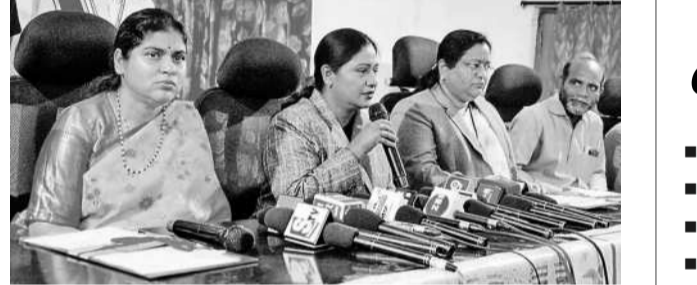
మాట్లాడుతున్న ప్రధాన న్యాయమూర్తులు

ఎప్పుడూ జేసేను ఎట్టా? నాకున్న ఎకరం వరకు భూమి ఎన్నో ఏండ్ల నుంచి టీడీపీవెళ్లింది. అయినా అక్కడనుంచి శ్రీ హెచ్సీ మోటరు 6 నెలలకు ఒకసారి రూ.185 కట్టాలిచ్చి, ఇప్పుడు మంతులు ఏండ్లు. అదే శ్రీ హెచ్సీ మోటర్ వాడు తున్నా. కానీ, ఇప్పుడు అధ్వాన్స్ రూ.480 కట్టుకుంటారు. సెన్ శ్రీ హెచ్సీ మోటర్ మార్కున్నా పై హెచ్సీ కింద మార్చిస్తారు. ఇంకో రూ.2700 కట్టాలి సెన్ అనేసాల్సి అంటున్నారు. ఇప్పటికే రైతుబంధులకు పెట్టబడిన పైసల్లో ఇబ్బంది పడుతున్నాయి. కరెంటు బిల్లులు ఇబ్బందుల్ని పట్టు వసూలు చేస్తే వ్యవసాయం ఎట్టా జింపం?