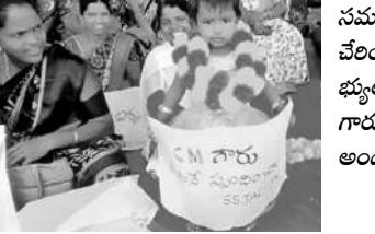
నమ్మగ్గి శిక్ష ఉద్దోగుల దీక్ష శనివారం 5వ రోజుకు చేరింది. జనగామలో కలెక్టర్ కేసుకు తుటుంబన పట్టుకోవడంతో కలిసి నిరసన తెలుపగా ఓ బిన్నారి సీఎం గారు స్పందించడం అంటూ ధ్వజార్ధ ప్రదర్శించడం అందరినీ ఆకట్టుకుంది.

వసతిగృహంలో ఏర్పాటు చేసిన కామస్ డైట్, కాస్టోటిక్ మెను చార్టును ప్రారంభించారు. పాఠశాల దశలోనే విద్యార్థులు మంచి మార్గాన్ని ఎంచుకోవాలని అనుకున్న లక్ష్మణ్ని సాధించాలన్నారు. చదువుతోనే సమాజంలో విలువ పెరుగుతుందని సూచించారు. అనంతరం వంటశాల, తాగునీరు, బాలికల వసతి, మధ్యాహ్న భోజనాన్ని పరిశీలి, విద్యార్థులతో కలిసి భోజనం చేశారు. అలాగే ఇందిరానగర్ కాలనీని ప్రభుత్వ గిరిజన బాలికల బాడీ పట్టణంలోని అద్దేవీ కార్యాలయం వద్దకు ఉన్న ప్రభుత్వ గిరిజన బాలికల ఆశ్రమ పాఠశాల