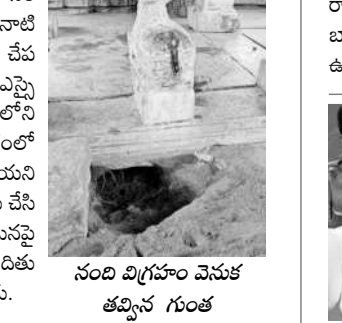
నంది విగ్రహం వెనుక తవ్విన గుంత