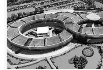
ఫార్మాసిటీ స్థానంలో జనరల్ ఇండస్ట్రియల్ పార్కును ఏర్పాటు చేసేందుకు టీజీవఐసి ఇప్పటికే రేఅప్లను కూడా సిద్ధం చేసింది. అక్కడ ముందుగా ఫార్మా పరిశ్రమలను కాకుండా సాధారణ పరిశ్రమలతో పాటు కాలవ్యాలను ఆస్కారం లేని ఔషధ కంపెనీలను అనుమతించాలని నిశ్చయించుకున్న తెలిసింది. ఔషధ పరిశ్రమలో పార్కులేషన్లు, బల్బుడెగ్గి తయారీ విభాగాలు ఎంతో టీలకమైనవి. ఇవి కాలవ్య స్థానాన్ని వ్యతిరేకత కావడంతో తొలుత రసాయనాల ఫ్యాక్టరీలు ఏర్పాటు చేయాలని, ఆ తర్వాత ఔషధ పరిశ్రమలకు గ్రీన్ సిగ్నల్ ఇవ్వాలని రేవంతుల భావిస్తున్నట్లు సమాచారం. ఇలా చేస్తే రద్దయిన ఫార్మాసిటీ మళ్లీ మనగడలోకి వచ్చే అవకాశం ఉంటుందని చెప్పుచున్నా.