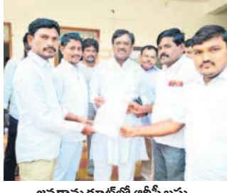
జనగామ రూట్లో ఆర్టీసీ బస్సు నడిపించాలని ఎమ్మెల్యే వివేకకు విసతి పత్రం అందజేస్తున్న నాయకులు (ఫైల్)

ఆ మార్గంలో ఆర్టీసీ బస్సు సేవలు నిలిపి పోయి ఆరు నెలలు దాటింది. 10 గ్రామాల ప్రజలు ఇబ్బందులు పడుతున్నా పట్టించుకోవే నాదుడే కరువయ్యాడు. మహా లక్ష్య పథకం ప్రవేశపెట్టామని ప్రభుత్వం గొప్పలు చెప్పుకుంటున్నా.. ఆ రూట్లో ఏ ఒక్క మహిళ కూడా ఉపయోగం లేకుండా పోయింది. 'జన మా సమస్య పట్టించుకోండి సార్లు..', అని సాక్షాత్తు ఎమ్మెల్యే వివేకకు విసతి పత్రం ఇచ్చినా ఫలితం మాత్రం శూన్యం.