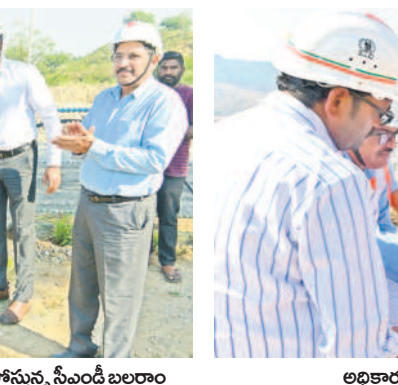
అధికారులతో కలిసి మ్యాప్ ను పరిశీలించు సీఎండ్