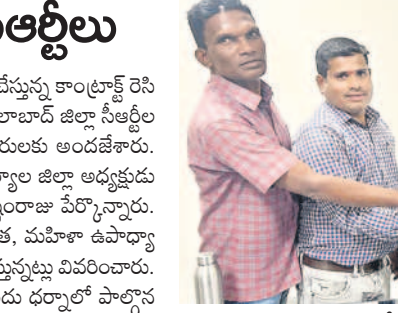
మంచెర్లాల డి.టి.డి.పాటు సమ్మెలో టీచర్లను అందజేస్తున్న సీఆర్టీలు