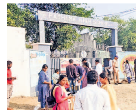
పరీక్ష కేంద్రంలోని వెళ్తున్న విద్యార్థులు