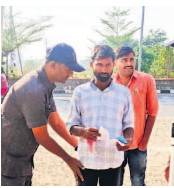
అభ్యర్థులను చెక్ చేస్తున్న పోలీసులు