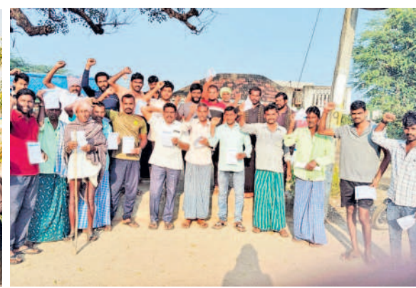
నెల్లికుమరులో ధర్మా పత్రాలను ఆవిష్కరిస్తున్న జీఎంపీఎం నాయకులు

భాగంగా గొర్రెలకుమలకు రెండో విడుదల గొర్రెలు పంపిణీ చేస్తామని హామీ ఇచ్చి విధాది గడువున్నా పట్టించుకోవడం లేదన్నారు. తమ ఓట్లు దండకొని అధికారంలోకి వచ్చిన కాంగ్రెస్ పాలకులు హామీల అమలును మరిచిపోయారని అన్నారు. ప్రభుత్వం తక్షణమే స్పందించి రెండో విడుదల లబ్ధిదారులను ఎంపిక చేసి వారి వ్యక్తిగత ఖాతాల్లో రూ. 2లక్షల నగదును బదిలీ చేయాలని డిమాండ్ చేశారు. రేపంతోనే గొర్రెలు, మేకల పెంపకం దారుల సంఘం ఆధ్వర్యంలో ప్రజాభివృద్ధి ముట్టడిస్తామని హెచ్చరించారు. ఈ కార్యక్రమంలో జీఎంపీఎం