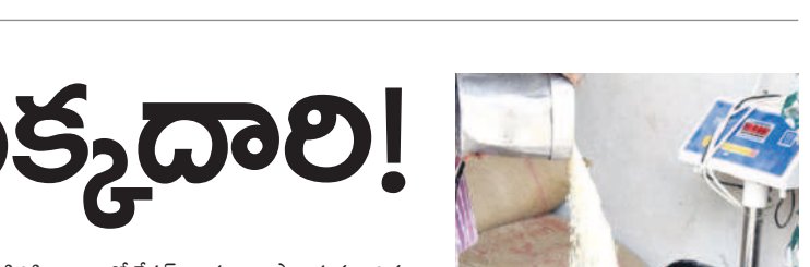
పల్లెజిల్లా: టీజీవీఎస్ సి నిబంధనలు అలస్యంతో పల్లె రాయని అభ్యర్థులు

కరీంనగర్ కమాన్ చౌరస్తా, డిసెంబర్ 15 : గ్రూప్ 2 ఎక్సామ్స్ మొదటి రోజు ప్రశాంతంగా జరిగింది. ఉదయం 10 గంటల నుంచి 12.30 గంటల వరకు, మధ్యాహ్నం 3 గంటల నుంచి 5.30 గంటల వరకు రెండు సెషన్లలో కొనసాగాయి. అభ్యర్థులను ఉదయం 8.30 నుంచి 9.30 గంటల వరకు, మధ్యాహ్నం 1.30 నుంచి 2.30 గంటల వరకు మాత్రమే లోనికి అనుమతించారు. అయితే కొందరు ఆలస్యంగా రాగా, అనుమతించలేదు. మరీకొందరు ఆలస్యంగా పరీక్షకు హాజరు కాలేదు. నేడ కూడా మొదటి రోజు వేళల్లోనే పరీక్షలు ఉడక నుండగా, అభ్యర్థులు తమకు కేటాయించిన పరీక్షా కేంద్రాలకు గంట ముందుగానే చేరుకోవాలని, టీజీవీఎస్ సి నిబంధనలు కచ్చితంగా పాటించాలని అధికారులు సూచించారు.