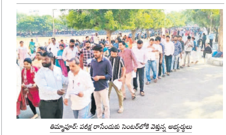
తిమ్మాపూర్: పల్లె రాసేందుకు నెంటర్లోకి వెళ్తున్న అభ్యర్థులు