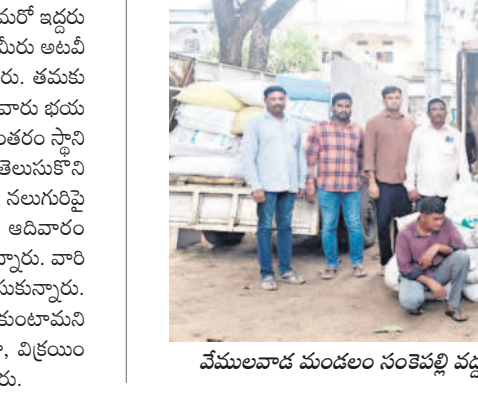
వేములవాడ మండలం సంకెపల్లి వద్ద రేషన్ బియ్యాన్ని పట్టుకున్న ట్యాన్ డ్రాఫ్ట్ పోలీసులు (పై)

పేదల బియ్యం పక్కదారి పడుతున్నది. నిషా కరువై దండా జోరుగా నడుస్తున్నది. పోలీస్ యంత్రాంగం తరచూ పట్టుకుంటున్నా. అక్రమ రవాణా నిషానిగతానే ఉన్నది. ఇప్పటికే సిరిసిల్లా జిల్లా వ్యాప్తంగా అనేక మందిని అరెస్ట్ చేసి రిమాండ్ కు తరలివినా.. కొత్తకొత్త ముఠాలు పుట్టుకొస్తూనే ఉన్నాయి. కొందరు డిలర్లు అక్రమారులతో చేతులు కలుపడడం వల్లే రేషన్ పక్కదారి పడుతున్నదనే ఆరోపణలు వెల్లువెత్తుతుండగా, సంబంధిత అధికారులు క్షేత్రస్థాయిలో పర్యవేక్షిస్తే దండాకు చెక్ పడుతుందనే అభిప్రాయాలు వ్యక్తమవుతున్నాయి.