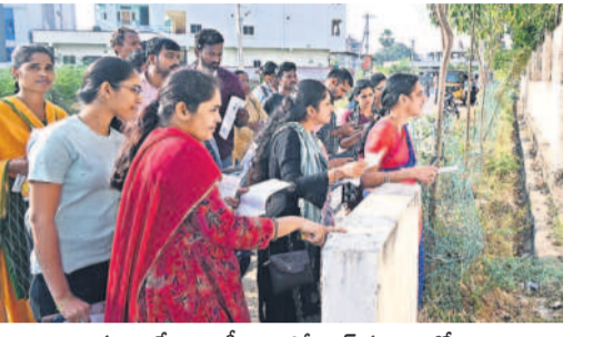
సూర్యాపేట : ఎస్సీ ఇంజనీరింగ్ కళాశాలలో హాల్ టికెట్ నందుకు చూసుకుంటున్న అభ్యర్థులు

రామగిరి/మిర్యాలగూడ/సూర్యాపేట/బిలుకూరు/సూర్యాపేట టౌన్, డిసెంబర్ 15 : తెలంగాణ రాష్ట్ర పబ్లిక్ సర్వీస్ కమిషన్ ఆది, సోమవారం నిర్వహించిన గ్రూప్-2 పరీక్షలు తొలిరోజు ఉమ్మడి జిల్లా వ్యాప్తంగా సజావుగా జరిగాయి. నల్లగొండ జిల్లాలో జిల్లా కేంద్రం తోపాటు మిర్యాలగూడలో 87 పరీక్షా కేంద్రాలు ఏర్పాటు చేశారు. పేపర్ -1 ఉదయం 10 గంటలకు, పేపర్ -2 మధ్యాహ్నం 3 గంటలకు ప్రారంభం కాగా, కొన్ని పరీక్ష కేంద్రాల వద్ద 10 మందికిపైగా అభ్యర్థులు ఆలస్యంగా రావడంతో అనుమతించలేదు. దీంతో కచ్చిత పర్యవేక్షణ వేసినట్లుగా మరో వైపు పరీక్ష సమయం సమీపిస్తుండటంతో అభ్యర్థులు లోపలికి వెళ్లగలకు తీశారు. ఉదయం హాజరుశాతం అధికంగా ఉన్నప్పటికీ మధ్యాహ్నం జరిగిన పరీక్షకు కొంత మేర తగ్గడం గమనార్హం. నల్లగొండ జిల్లా వ్యాప్తంగా 29,118 మంది అభ్యర్థులకుగానూ 14,676 మంది (50.40 శాతం) హాజరయ్యారు. 14,442 మంది గైర్జరయ్యారు.