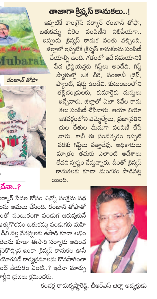
నాడు కేసీఆర్ సర్కార్ పేదల కోసం ఎన్నో సంక్షేమ పథకాలు, కార్యక్రమాలు అమలు చేసింది. రంజాన్ తోపాతో పేద ముస్లింలు ఎంతో సుఖంగా పండుగ జరుపుకునేవారు. తెలంగాణ అత్యగ్రహం బతుకమ్మ పండుగకు మహిళకు వీరలు ఇచ్చేది. దీని వల్ల సేవలకు ఉపాధి కూడా లభించేది. బతుకమ్మ వీరలను కూడా ఈసారి సర్కారు అందించలేదు. పండుగ దగ్గరకొచ్చిన ఇంకా క్రిస్మస్ కానుకల ఉపాధి లేదు. పేదలకు ఉపయోగపడే కార్యక్రమాలను కొనసాగించాలి. ఇంకా.. బండ్ల చేయడం ఏంటి..? ఇదేనా మార్పు అంటే.. కాంగ్రెస్ పార్టీని ప్రజలు క్షమించండి.

ఇప్పటికే కాంగ్రెస్ సర్కార్ రంజాన్ తోపా, బతుకమ్మ వీరల పంపిణీని నిలిపేయగా.. ఇప్పుడు క్రిస్మస్ కానుకలకు వంతు వచ్చింది. జిల్లాలో ఇప్పటికే క్రిస్మస్ కానుకలను పంపిణీ చేయాలి ఉంది. గతంలో ఇదే సమయానికి పేద క్రిస్మస్ కు గిఫ్ట్ లు అందేవి. గిఫ్ట్ ప్యాకుల్లో ఒక చీర, పంజాబీ డ్రెస్, ప్యాంటు, పుస్తకం ఉండేవి. కుటుంబంలోని తల్లిదండ్రులకు, కుమార్తెకు దుస్తులు ఇచ్చేవారు. జిల్లాలో ఏటా 2 వేల కానుకలు పంపిణీ చేసేవారు. ఆయా నియోజకవర్గాల్లోని ఎమ్మెల్యేలు, ప్రజాప్రతినిధుల చేతుల మీదుగా పంపిణీ చేసేవారు. కానీ ఈ సంవత్సరం ఇప్పటి వరకు గిఫ్ట్ లు పంపిణీ చేయలేదు. అధికారులు మాత్రం తమకు ఎలాంటి ఆడింపాలనే లేవనెత్తుతున్నట్లు చెప్పారు. దీంతో క్రిస్మస్ కానుకలకు కూడా మంగళం పాడినట్లు యాసంగి