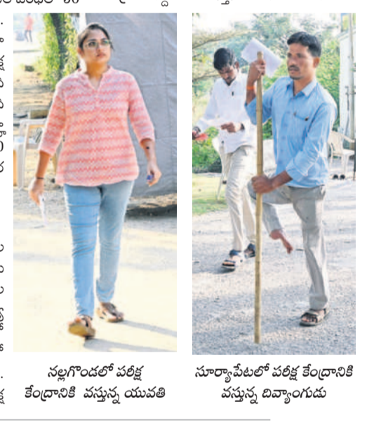
నల్లగొండలో పరీక్ష కేంద్రానికి వస్తున్న యువతి

జిల్లా వ్యాప్తంగా 49 పరీక్ష కేంద్రాల్లో గ్రూప్-2 పరీక్ష నిర్వహించారు. కొండా రిజిస్ట్రేషన్ పరిధిలో 19 పరీక్ష కేంద్రాలు, సూర్యాపేట రిజిస్ట్రేషన్ పరిధిలో 90 పరీక్ష కేంద్రాలు ఏర్పాటు చేశారు. 16,857 మంది అభ్యర్థులకుగానూ సగం మంది మాత్రమే పరీక్ష రాశారు. పేపర్-1 16,857 మంది అభ్యర్థులకుగానూ 8,608 మంది హాజరయ్యారు. 8,249 మంది గైర్జరయ్యారు. పేపర్-2కు 8,570 మంది (50.83 శాతం) హాజరయ్యారు.