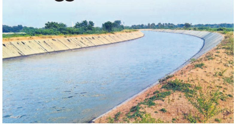
అధ్యుల పరిధిలో ఎన్నో రోజులు కాల్యం (ఫైల్)

సూర్యాపేటలో గత పదేండ్ల ఖిలేర్ వద్ద హయాంలో అన్ని రంగాలతోపాటు రైతులకు బలపడ్డారు. దశాబ్దాల తరబడి నీటి ముక్కకు నోచుకోని పంట భూములకు ముఖ్యమంత్రి కేసీఆర్ అత్యంత ప్రతిష్టాత్మకంగా పూర్తి చేసిన కాళేశ్వరం ప్రాజెక్టుతో గోదావరి జలాలు తీసుకొచ్చి సమగ్రమైన మలం చేశారు. ప్రధానంగా సూర్యాపేట జిల్లా పరిధిలో 2.95 లక్షల ఎకరాల శ్రీరాంసాగర్ ఆయకట్టు పరిధిలోని రైతులకు గత ఉమ్మడి రాష్ట్రంలో పీడకలగా ఉండగా కాళేశ్వరం జలాలు రావడంతో తలెత్తుకొని రైతలు సంతోషంగా జీవనం సాగించారు. ఇంతవరకు భాగానే నీటి విడుదలపై షెడ్యూల్ ప్రకారమే కాకుండా పంట చేతికి వచ్చేంత వరకు, రైతులు నీటి విడుదల నిలిపివేయాలని కోరేంత వరకు విడుదల చేశారు. ఈ సారి ఇప్పటికే నీటి విడుదల షెడ్యూల్ ఖరార కాకపోవడం పట్ల జలాలు వస్తాయా లేదా అనేది ప్రశ్నార్థకంగా మారింది. కాంగ్రెస్ ప్రభుత్వం అధికారంలోకి వచ్చిన తరువాత నీటి నిర్వహణ లోపంతో పంటలు ఎండబెట్టగా ఈ సారి పరిస్థితి ఎలా ఉంటుందోనని రైతులు ఆయామయానికి గురవుతున్నారు.