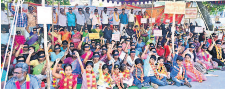
తమ డిమాండ్లను నిరవహించేందుకు డిమాండ్ చేస్తూ సమగ్రకక్ష ఉద్యోగులు చేస్తున్న సమ్మతి అధికారం ఆలోచన కొనసాగింది. ఈ సందర్భంగా ఉద్యోగులు నల్లగొండలోని కలెక్టరేట్ వద్ద తమ కుటుంబ సభ్యులతో కలిసి కళ్లకు గంతులు కట్టుకొని నిరసన వ్యక్తం చేశారు.