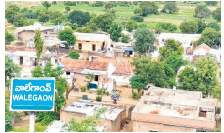
దాదాపు 50 శాతం మంది రైతులు రుణమాఫీకి నోచుకోని వాలెగాం గ్రామం

రైతులకు మాఫీ కాలేదే అత్రం చేసుకోవచ్చు. ఇలా వేల సంఖ్యలో రైతులకు రుణమాఫీ పెం దింగోలో ఉండడంతో తమకు మాఫీ అవుతుందా? లేదా అనే ఆయామయంలో అన్నదాతలు ఉన్నారు. అన్ని అర్హులు ఉన్నప్పటికీ మాఫీ ఎందుకు వర్తించడం లేదని వారు కాంగ్రెస్ పార్టీని అభిదారులు చెబుతున్నారు. వీరిలో 71,565 మందికి మాత్రమే మాఫీ అయింది. ఇంకా.. దాదాపు 48 వేల మంది రైతులకు మాఫీ కాలేదు. వీరిలో 18 వేల మంది వరకు ఉద్యోగులు, పెన్షనర్లు, ఐటీ పేయర్లు వంటి అనర్హులు పోగా, మిగతా 30 వేల మందికి రుణాలు పొందినవారు ఉంటారని అంచనా.