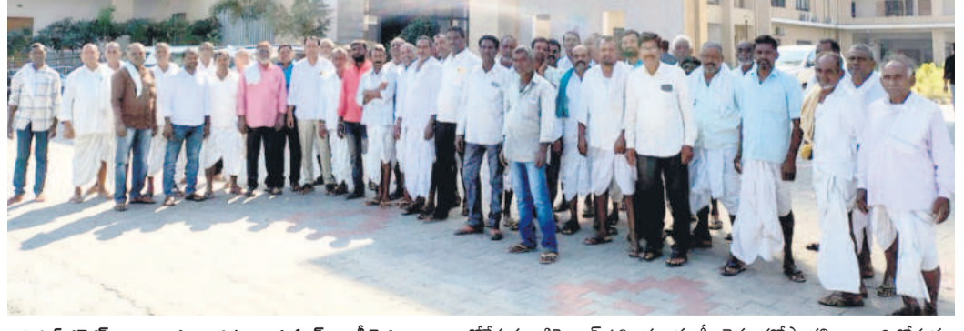
నిర్మల్ కలెక్టర్ కార్యాలయం ఎదుట రాయపూర్ కాండ్ల రైతులు

నిర్మల్ లో ప్రశాంతం నిర్మల్ అర్బన్, డిసెంబర్ 16 : నిర్మల్ జిల్లాలో సోమవారం నిర్వహించిన గ్రూప్-2 పరీక్ష ప్రశాంతంగా ముగిసింది. రెండు రోజులపాటు అధికారులు పరీక్షను నిర్వహించారు. ఆదివారం పేపర్-1,2 పరీక్షను నిర్వహించగా.. రెండో రోజులో సోమవారం పేపర్-3,4 నిర్వహించారు. నిమిషం అమలులో ఉండడంతో అభ్యర్థులు గంట ముందుగానే కేంద్రాలకు చేరుకున్నారు. పరీక్షలను పక్కాగా నిర్వహించేందుకు ఎస్సీ జానకి పట్టణ 163 సెక్షన్లను అమలు పరిచారు.