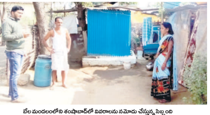
బేల మండలంలోని శంషాబాద్ లో వివరాలను నమోదు చేస్తున్న సిబ్బంది

ఆసిఫాబాద్ నియోజకవర్గంలో రెండు మండలాలు ఉన్నాయి. కేవలం ఆదిలాబాద్ నియోజకవర్గం నుంచి 71,609 మంది దరఖాస్తు చేసుకున్నారు. ఆదిలాబాద్ నియోజకవర్గంలో ఐదు మండలాలు ఉండగా ఒక్కో మండలానికి 700 ఇండ్లు, బోధన్ నియోజకవర్గంలో తొమ్మిది మండలాలు ఉండగా మొదటి విడుదలలో ప్రతి మండలానికి 388 ఇండ్లు మాత్రమే వచ్చే అవకాశాలున్నాయి. మొదటి విడుదలలో సౌంత్ కలేనా ఉన్న పేదలకు రూ.5 లక్షలు మంజూరు చేస్తారు. ఇంటి నిర్మాణంలో బాగాంగా దశలవారీగా మూడు విడుదలల్లో అభిదారులకు డబ్బులు అందజేస్తారు. ప్రభుత్వం యావన్ ఇందిరమ్మ ఇండ్ల అభిదారులు వివరాల నమోదు ప్రక్రియ ప్రారంభించడంలో దరఖాస్తుదారులు ఆకా ఏడుగురు చూస్తున్నారు. ప్రభుత్వం ఎక్కువ ఇండ్లను మంజూరు చేసి అర్హులైన వారందరికీ ఇండ్లను అందజేయాలని దరఖాస్తుదారులు కోరుతున్నారు.