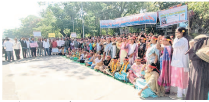
జాతీయ రహదారిపై చెవిలో పూలు పెట్టుకుని నిరసన తెలుపుతున్న కాంట్రాక్ట్ ఉద్యోగులు