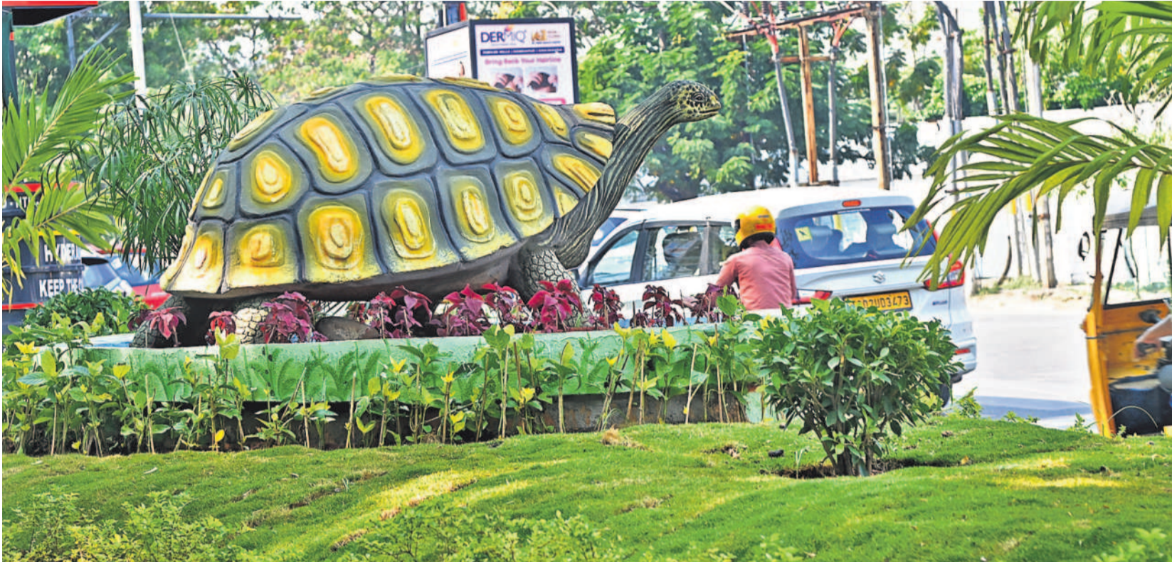
తాబేలు.. భలే బాగు.. జంక్షన్ సుందరీకరణలో భాగంగా నాగార్జున సర్కిల్-కేబిల్ పార్క్ రోడ్లో ఏర్పాటు చేసిన తాబేలు ఆకృతి

పనుల్లో నాణ్యతను మెరుగుపర్చేందుకు ఈ అవగాహన కార్యక్రమం దోహదపడుతుందని ఎంఓఆర్ రెడ్డి పేర్కొన్నారు. జలమండలి చేపట్టిన 90 కోట్ల రూపాయలతో చేపట్టిన డీ సిల్లింగ్ వివరాలను ఆన్లైన్లో సమాచారం చేయాలని తెలిపారు. సీవరేజీ ఓవర్ ఫ్లో ప్రీ సిటీ హైదరాబాద్ లక్ష్యంగా జలమండలి చేపట్టిన 90 కోట్ల రూపాయలతో చేపట్టిన డీ సిల్లింగ్ పనులకు అధికారులతో సమీక్ష నిర్వహించారు. జమ్మిటి వరకు 14 వేల ప్రాంతాల్లో 1,758 కిలోమీటర్ల మేర సీవరేజీ పనులపైనున్న డీ సిల్లింగ్ పనులు నిర్వహించినట్లు ఈ డి.టి.ఎం. లో తెలిపారు. లక్షా 40వేల రూపాయలతో పనులు చేపట్టినట్లు వెల్లడించారు.