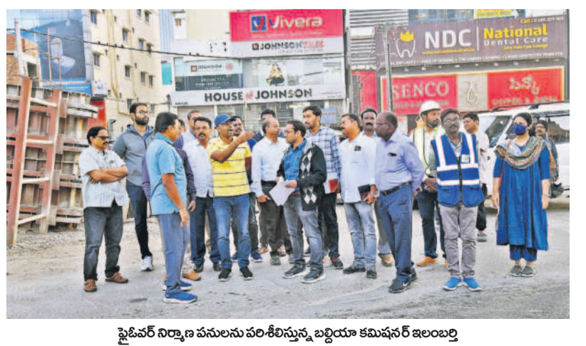
మేడ్చల్ నిర్మాణ పనులను పరిశీలించు, బల్లియా కమిషన్ ఇంజనీర్లు

మేడ్చల్, శామిల్ వేల వరకు మెట్రో నిర్మాణంపై లక్ష్యాన్ని మేడ్చల్ మెట్రో సాధన సమితి విమాతృ కార్యక్రమాలకు శ్రీకారం చుడుతున్నది. నార్కెట్ సిటీ మెట్రో సాధన ప్రాముఖ్యతను వివరిస్తూ ఇప్పటికే పలు కార్యక్రమాలు, నిరసనలు, ఆందోళనలను చేపట్టింది. తాజాగా మేడ్చల్ మెట్రో సాధన సమితి అధ్యక్షులతో కాలనీకోక కమ్యూనిటీని ఏర్పాటు చేస్తోంది. ప్యారడైజ్ నుంచి మేడ్చల్ వరకు, జేబీఎన్ నుంచి శామిల్ వేల వరకు ఉన్న కాలనీ వాసులను కలుపుకోవాలని, కమ్యూనిటీ బిల్డింగ్ వేరీలు ఇంటింటికీ నార్కెట్ సిటీ మెట్రో ఉద్యమాన్ని తీసుకోవడంలో భాగమని మెట్రో సాధన