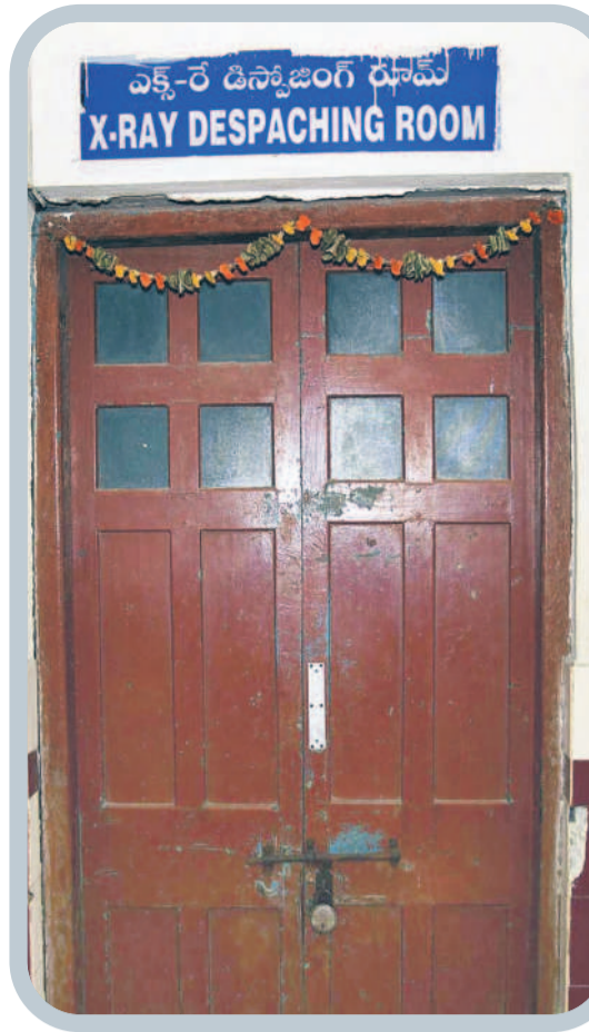
జీజీహెచ్లో ఎక్స్రే రివీవర్ మూసి ఉంచిన గది