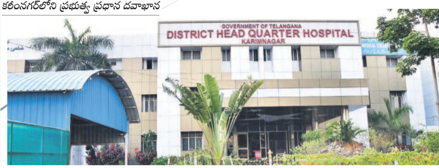
కరీంనగర్లోని ప్రభుత్వ ప్రధాన దవాఖాన