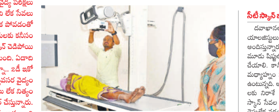
ఆరోగ్య మహిళా కేంద్రం ఏర్పాటు చేసిన ఎక్స్రే గదిలో ప్రభుత్వ దవాఖాన పేషెంట్లకు ఎక్స్రే తీస్తున్న సిబ్బంది

ఇక్కడ ఎక్స్రే విభాగం కూడా పని చేయడం లేదు. 15 రోజుల కింద మిషన్ చెడిపోతే ఇప్పటి వరకు బాగు చేయించలేదు. ప్రస్తుతం ఇదే దవాఖాన ఆవరణలో ఏర్పాటు చేసిన ఆరోగ్య మహిళా కేంద్రంలోని ఎక్స్రేను తాత్కాలికంగా వినియోగించుతుంటున్నారు. ప్రతి మంగళ, బుధ, శుక్రవారాల్లో మహిళలకు ప్రత్యేక పరికరాలు నిర్వహిస్తున్నారు. దీంతో ఆ మూడు రోజులు సాధారణ డెబ్బలతో వచ్చే రోగులు ఇబ్బందులు పడుతున్నారు. ప్రతి రోజూ 180 నుంచి 200 మందికి ఇక్కడ ఎక్స్రే పరికరాలు నిర్వహిస్తున్నారు. ఆరోగ్య మహిళా కేంద్రంలోనూ సరిపడా సిబ్బంది లేక పని భారం పెరుగుతున్నది. ఎక్స్రే మిషన్లను బాగు చేసేందుకు నిధులు కూడా అందుబాటులో లేని పరిస్థితి నెలకొన్నది. దీంతో ఆరోగ్య మహిళా కేంద్రంలోని ఎక్స్రే మిషన్పై ఓవర్ బర్డెన్ పడుతున్నది. పరిస్థితి ఇలాగే ఉంటే ఇది కూడా చెడిపోయే ప్రమాదం ఉన్నది.