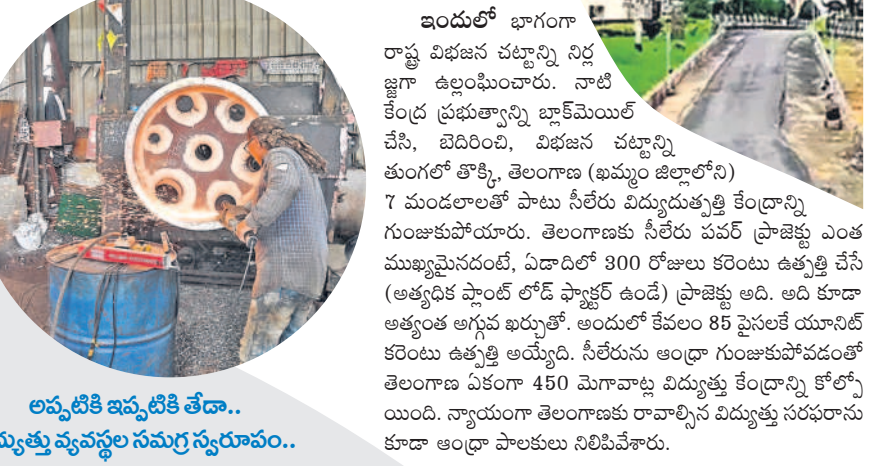
ఇందులో భాగంగా రాష్ట్ర విభజన చట్టాన్ని నిర్లక్ష్యం ఉల్లంఘించారు. నాటి సమైక్య ప్రభుత్వాన్ని బ్లాక్ మెయిల్ చేసి, విడిచిపెట్టి, విభజన చట్టాన్ని తుంగలో తొక్కి, తెలంగాణ (అవ్వం జిల్లాలోని) 7 మండలాలతో పాటు సీలేరు విద్యుదుత్పత్తి కేంద్రాన్ని గుంటూరులోని తెలంగాణకు సీలేరు పవర్ ప్రాజెక్టు ఎంత ముఖ్యమైనదంటే, ఏడాదిలో 300 రోజులు కరెంటు ఉత్పత్తి చేసే (అత్యధిక ప్లాంట్ లోడ్ ఫ్యాక్టర్ ఉండే) ప్రాజెక్టు అది. అది కూడా అత్యంత అగ్నేప భర్త్యుతో. అందులో కేవలం 85 పైసలకే యూనిట్ కరెంటు ఉత్పత్తి అయ్యింది. సీలేరును ఆంధ్రా గుంటూరుతోపాటు తెలంగాణ ఏకంగా 450 మెగావాట్ల విద్యుత్తు కేంద్రాన్ని కోల్పోయింది. న్యాయంగా తెలంగాణకు రావాల్సిన విద్యుత్తు సరఫరాను కూడా ఆంధ్రా పాలకులు నిలిపివేశారు.

అయితే తదంతర పరిణామాలు ఇందుకు భిన్నంగా జరిగాయి. నాటి సమైక్య పాలకులు, ఆంధ్రా ప్రావింట్, నాయకుల అభీప్రాయ విరుద్ధంగా ఏర్పాటైన తెలంగాణను ఏర్పాటు చేసిన రాష్ట్రంగా మారినదానికి సమైక్య పాలకులు కంకణం కట్టుకున్నారు. తెలంగాణను దెబ్బకొట్టడానికి వారు సమైక్య పాలకులు కున్న మొట్టమొదటి అడ్డం కరెంటు. ఆంధ్రాలో కలిసి లేకుంటే తెలంగాణ చీకట్లో మగ్గుండా అంతకుముందే పవర్ హాలిడే ప్రజెంటేషన్ హెచ్చరికలు జారితేసిన సమైక్య పాలకులు, రాష్ట్ర ఏర్పాటు తర్వాత అన్యంత పని చేయడానికి తగినట్లయ్యింది. కరెంటు లేకుంటే తెలంగాణ బతుకలేని, చావలేని దయనీయ స్థితిలో చదుకుందనే ఎత్తుగడ వేసి, పెను దుర్మూర్ఖుని తెరతీశారు.