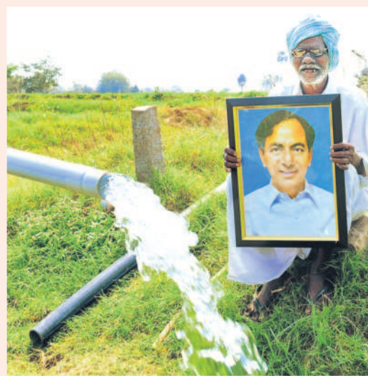
విద్యుత్తుతో ఏ లాభం జరిగింది? ఏ దేశమైనా లేదా రాష్ట్రమైనా ఆర్థికంగా, సామాజికంగా సర్వోత్కృష్టాభివృద్ధి సాధించాలంటే నిరంతరాయ విద్యుత్తు సరఫరా కీలకమైన నిపుణులు చెప్పారు. కేసీఆర్ ఉక్కు సంకల్పంతో రాష్ట్రం ఏర్పడిన కేవలం ఆరేండ్ల ఆరు నెలల్లోనే కోతలు లేని తెలంగాణ సుసాధ్యమైంది. 24 గంటల నిరంతరాయ విద్యుత్తు సరఫరా సాకారమైంది. స్థాపిత విద్యుత్తు సామర్థ్యం అంచనాలకు మించి అందుబాటులోకి వచ్చింది. నిరంతరాయ విద్యుత్తు సరఫరా జరగడం, పవర్ కట్స్ లేకపోవడంతో హైదరాబాద్ కు ఇటీవలే కంపెనీలు క్యూ కట్టాయి. రాష్ట్రవ్యాప్తంగా పరిశ్రమలు కొలుపుడి రాయి. మూతబద్ధ కంపెనీలు తెరుచుకొన్నాయి. ప్రజలకు చేరినాడే పని దొరికింది. ఏటా లక్షల మోటార్లకు కాలే స్థితి నుంచి సాగనీటితో వంట పాతాళం కళకళలాడే రోజులు వచ్చాయి. పారిశ్రామిక, వ్యావసాయక ప్రగతి జరిగింది. దేశానికి తెలంగాణ ధాన్యాగారమైంది. ప్రజల జీవన ప్రమాణం పెరిగింది. జనరేటర్లు, ఇన్వర్టర్లు, కన్వర్టర్లు మాయమై.. హైదరాబాద్ వంటి నగరాలే కాదు ఆదిలాబాద్ లోని కుగ్రామాలు కూడా నిరంతరాయ విద్యుత్తు వెలుగుతో దగ్ధగలాడాయి. తెలంగాణలో 'ఒకప్పుడు కరెంటు ఉంటే వార్డు, ఇప్పుడు కరెంటు పోతే వార్డు' అనే నినాదం ప్రపంచవ్యాప్తంగా మార్చాల్సింది.

మెగావాట్లగా ఉన్న స్థాపిత విద్యుత్తు సామర్థ్యం 023-24నాటికి 19,519 మెగావాట్లకు (108 శాతం పెరుగుదల) చేరినట్లు వివరించింది. పెద్ద రాష్ట్రాల కంటే మనమే గ్రేట్ తొమ్మిదిన్నరేండ్ల బీఆర్ఎస్ పాలనలో స్థాపిత విద్యుత్తు సామర్థ్యం పెరుగుదల చూసుకున్నా అలసరి విద్యుత్తు వినియోగంలో నమోదైన పెరుగుదల చూసుకున్నా దేశంలోని అన్ని ప్రధాన రాష్ట్రాల కంటే తెలంగాణనే ఎంతో ముందున్నట్లు ఆర్టీఐ పేర్కొంది. దేశంలో సగటు తలసరి విద్యుత్తు వినియోగం 1,340 యూనిట్లుగా నమోదైతే, తెలంగాణలో ఇది 2,398 యూనిట్లుగా నమోదుకావడం గమనార్హం. అంటే దేశీయ తలసరి విద్యుత్తు వినియోగంతో పోలిస్తే తెలంగాణ పౌరుడు సగటున 1,058 యూనిట్ల ఎక్కువ కరెంటును వినియోగించుకుంటున్నట్లు ఆర్టీఐ పేర్కొంది.