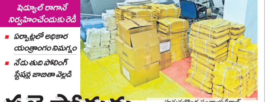
షెడ్యూల్డ్ రాగానే నిర్వహించేందుకు రెడీ

పల్లెపోరుకు కనరత్తు మొదలైంది. షెడ్యూల్డ్ ఎప్పుడొచ్చినా గ్రామ పంచాయతీ ఎన్నికల నిర్వహించేందుకు అధికారం యంత్రాంగం సన్నద్ధమైంది. ఇందులో భాగంగా అన్ని ఏర్పాట్లు చేస్తుండగా ఇప్పటికే గ్రామాలు, వార్డుల వారీగా ఓటరు జాబితాను సిద్ధం చేసింది. ఇటీవలే పోలింగ్ కేంద్రాల గుర్తింపు పూర్తయిన ముసాయిదా జాబితాను ప్రకటించి అభ్యంతరాలు స్వీకరించింది. నేడు పోలింగ్ స్టేషన్ల తుది జాబితాను వెల్లడించనున్నది. అలాగే బ్యాటిల్ పేపర్లు ప్రింటింగ్ చేసి సిద్ధంగా ఉండాలని రాష్ట్ర ప్రభుత్వం ఆదేశాలు జారీచేయగా ఆమెరకు పీఆర్ అధికారులు ఏర్పాట్లు చేస్తున్నారు. ఈ సేవల్లో పల్లెల్లో ఎన్నికల సందడి మొదలుకాగా, ఆశాపహలు క్షేత్రస్థాయిలో పర్యటించే ప్రజలతో మమేకం అవుతుండడంతో రాజకీయం రసవత్తరంగా మారుతున్నది. - జనగామ, డిసెంబర్ 16 (నమస్తే తెలంగాణ)/హనుమకొండ