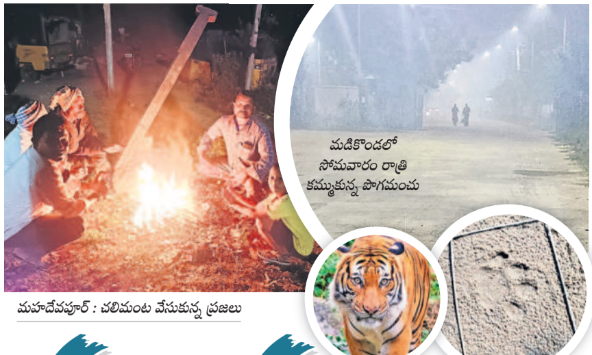
మడికొండలో సోమవారం రాత్రి కమ్ముతున్న పొగమంచు