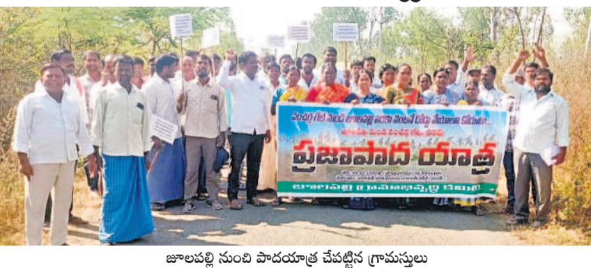
జూలపల్లి నుంచి పాదయాత్ర చేపట్టిన గ్రామస్థులు