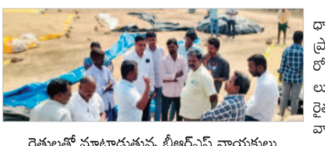
రైతులతో మాట్లాడుతున్న బీఆర్ఎస్ నాయకులు

బల్లూరు, డిసెంబర్ 16 : తెలంగాణ ప్రభుత్వం గొప్పలు చెప్పుకోవడం తప్పా ధాన్యం కొనుగోలు చేయడం లేదని బీఆర్ఎస్ నాయకులు నాగయ్య, రాములు, తిరుపతయ్యలు అన్నారు. మండలకేంద్రంలో పరిశోధన సంఘం ఆధ్వర్యంలో గతవారంలో