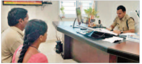
ఫిర్యాదుదారులతో మాట్లాడుతున్న ఎస్పీ గ్రెగోర్

● ఎస్పీ గ్రెగోర్ వైభవ రఘునాథ్ నాగర్ కర్నూల్, డిసెంబర్ 16 : ప్రజావాణి ప్రజలకు సమస్యలను పరిష్కరించే అధికారుల చర్యలు తీసుకోవాలని ఎస్పీ గ్రెగోర్ వైభవ రఘునాథ్ సూచించారు. సోమవారం జిల్లాలోని వివిధ ప్రాంతాల నుంచి వచ్చిన ఏడు ఫిర్యాదులకు పరిష్కార చర్యలు తీసుకోవాలని ఎస్పీ గ్రెగోర్ వైభవ రఘునాథ్ సూచించారు. అధికారులు నిర్లక్ష్యంగా వ్యవహరించకుండా పరిష్కరించే చర్యలు తీసుకోవాలని ఎస్పీ గ్రెగోర్ వైభవ రఘునాథ్ సూచించారు.