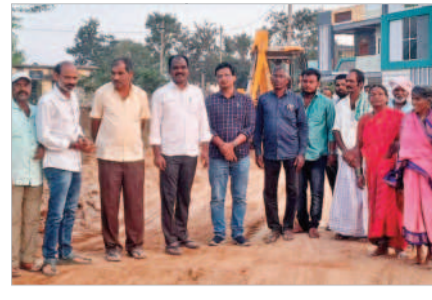
సీసీ రోడ్డు పనులు పరిశీలిస్తున్న మునిఫుల్ డైరెక్టర్