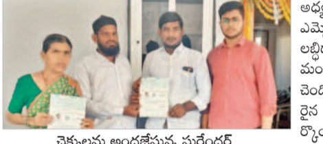
చెక్కులను అందజేస్తున్న సురేందర్

వంగూరు, డిసెంబర్ 16 : ఉమ్మడి జిల్లా ఎమ్మెల్యే సురేందర్ కుమార్ రెడ్డి, మాజీ ఎమ్మెల్యే గుమ్మల బాలరాజు సహకారంతో మంజూరైన సీఎంఆర్ఎఫ్ చెక్కులను సోమవారం జిల్లా కేటీఆర్ హాలులో జిల్లా