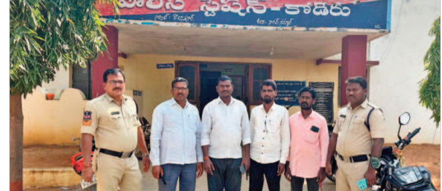
కోడేరులో అరెస్టు అయిన బీఆర్ఎస్ నాయకులు