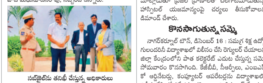
సబ్ జైల్ ను తనిఖీ చేస్తున్న అధికారులు