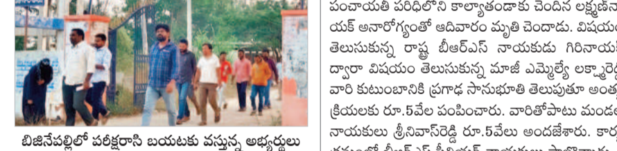
బిజినెస్ పరీక్షలకు పాల్గొన్న అభ్యర్థులు

తంగా ముగిసింది. జిల్లాపరిషత్ బాలూరు, బాలికల పాఠశాలలో పాఠశాల అలీనాయింట్స్ పాఠశాల, పాలెంలో శ్రీ వెంకటేశ్వర ప్రభుత్వ జూనియర్, డిగ్రీ కళాశాలలో పాఠశాల జిడ్డి ఉన్న పాఠశాలలో పరీక్షా కేంద్రాలను ఏర్పాటు చేశారు. తానీల్లార శ్రీరాములు, ఎంపీపీపీ ఖతలపు, ఎస్పీ నీలవసూలు పరీక్షా కేంద్రాలుగా నిర్వహించారు.