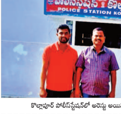
కొల్లూపూర్ పోలీస్ స్టేషన్ లో అరెస్టు అయిన బీఆర్ఎస్ నాయకులు