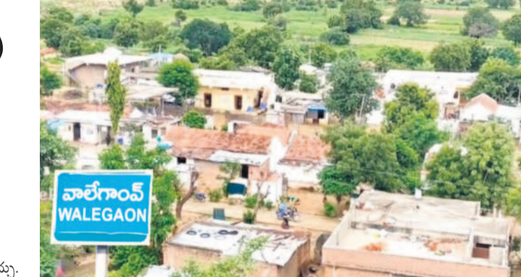
దాదాపు 50 శాతం మంది రైతులు రుణమాఫీకి నో-చుకీరి వాలేగాం గ్రామం

రైతులకు మాఫీ కాలేదు అన్న విషయం అసహనం తో చూస్తూ ఉన్నారు. అన్ని అర్హులకు కనుక మాఫీ అయ్యేనా అంటూ అందరికీ ఉద్వేగం వ్యక్తం చేస్తున్నారు. అధికారంలోకి రాగానే లక్షలు చేస్తామని ప్రగల్భాలు పలికి, తీరా సమంజసమని రైతులు ప్రశ్నిస్తున్నారు.