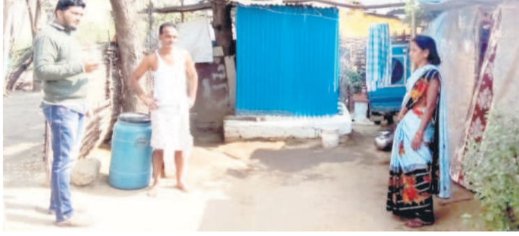
బేలమండలంలోని శంషాబాద్ లోని వివరాలను నమోదు చేస్తున్న సిబ్బంది

ఆసిఫాబాద్ నియోజకవర్గంలో రెండు మండలాలు ఉన్నాయి. కేవలం ఆదిలాబాద్ నియోజకవర్గం నుంచి 71,609 మంది దరఖాస్తు చేసుకున్నారు. ఆదిలాబాద్ నియోజకవర్గంలో ఐదు మండలాలు ఉండగా ఒక్కో మండలానికి 700 ఇండ్లు, బోధన్ నియోజకవర్గంలో తొమ్మిది మండలాలు ఉండగా మొదటి విడుదలలో ప్రతి మండలానికి 388 ఇండ్లు మాత్రమే వచ్చే అవకాశాలున్నాయి. మొదటి విడుదలలో సౌంత్ కలేనా ఉన్న పేదలకు రూ.5 లక్షలు మంజూరు చేస్తారు. ఇంటి నిర్మాణంలో భాగంగా దళవారిగా మూడు విడుదలల్లో అర్హులకు డబ్బులు అందజేస్తారు. ప్రభుత్వం యాపీలో ఇందిరమ్మ ఇండ్ల అర్హులను వివరాల నమోదు ప్రక్రియ ప్రారంభించడంలో దరఖాస్తుదారులు ఆకాష్ ఎదురు చూస్తున్నారు. ప్రభుత్వం ఎక్కువ ఇండ్లను మంజూరు చేసి అర్హులైన వారందరికీ ఇండ్లను అందజేయాలని దరఖాస్తుదారులు కోరుతున్నారు.