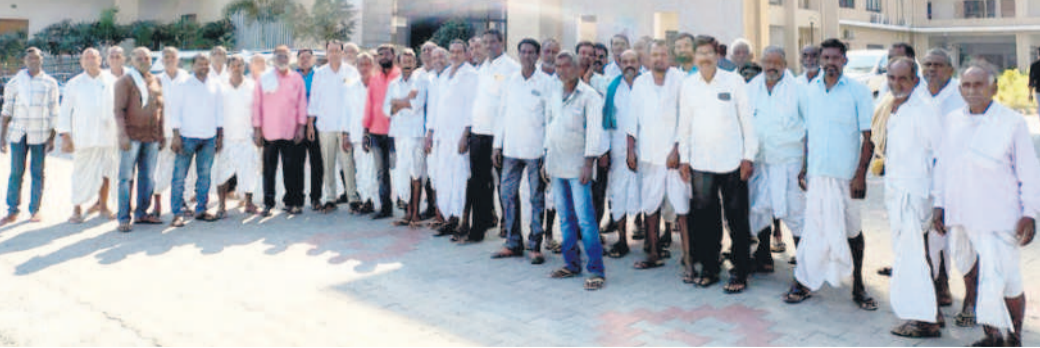
నిర్మల్ కలెక్టర్ కార్యాలయం ఎదుట రాయపూర్ కాండ్ల రైతులు