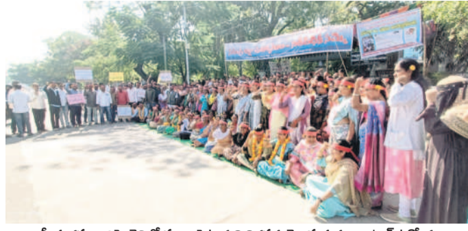
జాతీయ రవాణా రైతులకు ఫిటో ఫిటో ఫిటో పాతకాలు నివారణ తెలుపుతున్న కాంట్రాక్ట్ ఉద్యోగులు