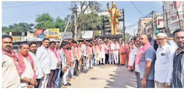
హస్తాంతరం చొరస్తూ అంబేద్కర్ విగ్రహానికి వినతిపత్రం అందజేసి నిరసన తెలియజేస్తున్న కార్పొరేటర్ నల్లంపూచూడ, బీఆర్‌ఎస్ శ్రేణులు