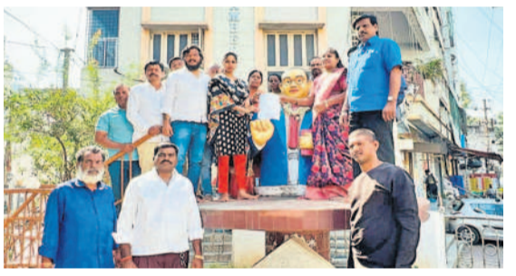
సీతాపేటమండల అంబేద్కర్ విగ్రహానికి వినతిపత్రం అందజేస్తున్న సికింద్రాబాద్ కార్పొరేటర్ హేమ, బొడ్లనగర్ డివిజన్ కార్పొరేటర్ శైలజ, బీఆర్‌ఎస్ పార్టీ నాయకులు