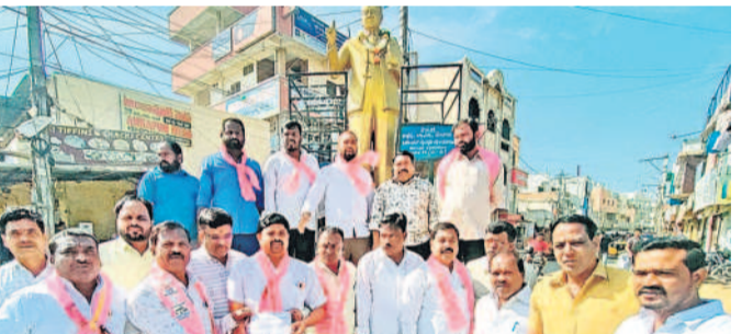
మెడ్చల్లో అంబేద్కర్ విగ్రహానికి వినతిపత్రం అందజేస్తున్న బీఆర్‌ఎస్ నేతలు