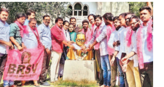
ఓయా లా కళాశాలలోని అంబేద్కర్ విగ్రహానికి వినతిపత్రం సమర్పించిన బీఆర్‌ఎస్ నాయకులు