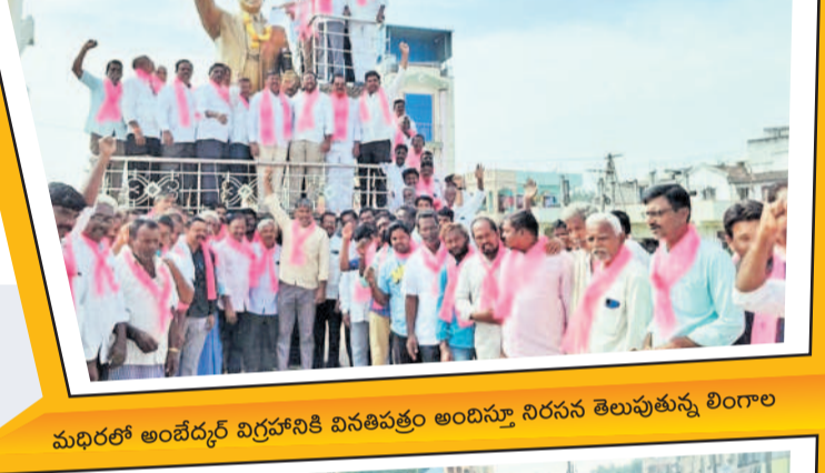
మధురలో అంబేద్కర్ విగ్రహానికి వినతిపత్రం అందిస్తూ నిరసన తెలుపుతున్న లింగాల