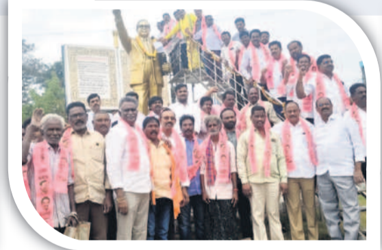
ములకలపల్లి: రాజ్యాంగ నిర్మాత విగ్రహానికి వినతి పత్రం ఇస్తున్న నాయకులు