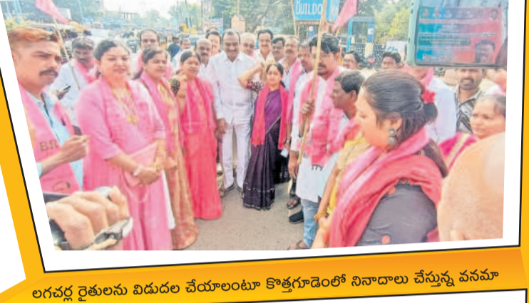
లగచర్ల రైతులను విడుదల చేయాలంటూ కొత్తగూడెంలో నినాదాలు చేస్తున్న వనమా