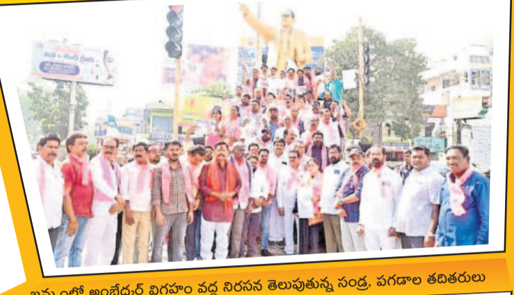
ఖమ్మంలో అంబేద్కర్ విగ్రహం వద్ద నిరసన తెలుపుతున్న సంద్ర, వగదాల తదితరులు