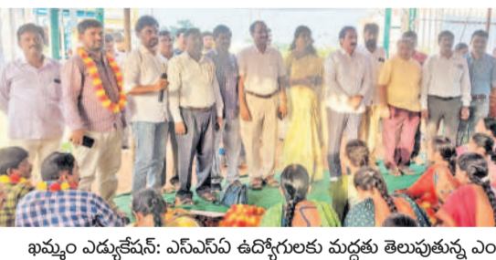
ఖమ్మం ఎడ్వకేషన్: ఎన్ఎన్వీ ఉద్యోగులకు మద్దతు తెలుపుతున్న ఎంతోమంది