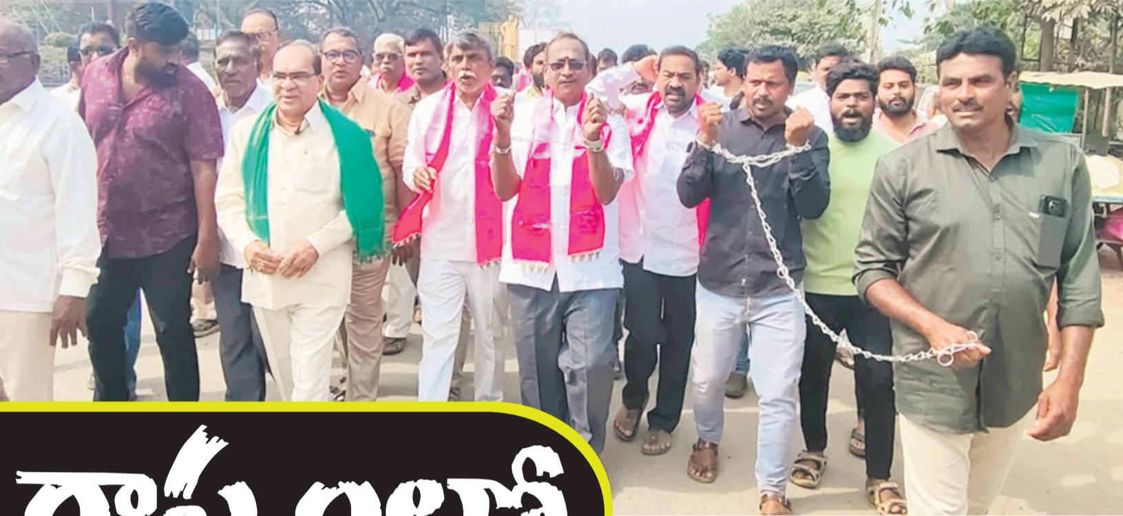
అస్సాపుపేట: లగచర్ల రైతులపై అక్రమ కేసులు బనాయించడాన్ని, వారిని జైలు నుంచి విడుదల చేయకపోవడాన్ని నిరసిస్తూ చేతికి సంకెళ్లతో నిరసన తెలుపుతున్న బీఆర్ఎస్ శ్రేణులు, బిత్తంలో మెచ్చా