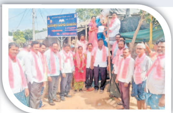
ములకలపల్లి: రాజ్యాంగ నిర్మాత విగ్రహానికి వినతి పత్రం ఇస్తున్న నాయకులు