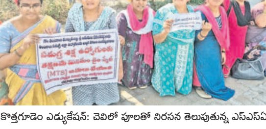
కొత్తగూడెం ఎడ్వకేషన్: చెవిలో పూలతో నిరసన తెలుపుతున్న ఎన్ఎన్వీ ఉద్యోగులు