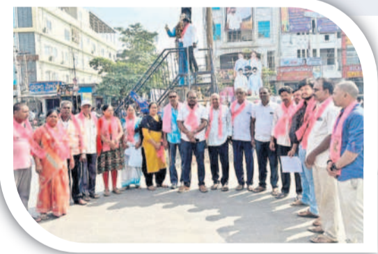
భద్రాచలం: నిరసన కార్యక్రమంలో మాట్లాడుతున్న బీఆర్ఎస్ శ్రేణులు సత్తుపల్లి టౌన్: అంబేద్కర్ విగ్రహానికి వినతి పత్రం ఇస్తున్న బీఆర్ఎస్ నేతలు