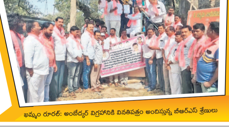
ఖమ్మం రూరల్: అంబేద్కర్ విగ్రహానికి వినతిపత్రం అందిస్తున్న బీఆర్ఎస్ శ్రేణులు