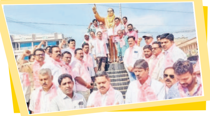
ముఖ్యమంత్రి అంబేద్కర్ విగ్రహానికి వినతిపత్రం అందజేస్తున్న బీఆర్ఎస్ జిల్లా అధ్యక్షుడు రేగా