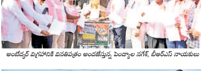
అంటే దర్జా విధిస్తామని వివరించి చెప్పారు పెంద్యాల నగర్, బీఆర్ఎస్ నాయకులు

లగచ్చర్ రైతుల విషయంలో కార్యక్రమం హక్కులు