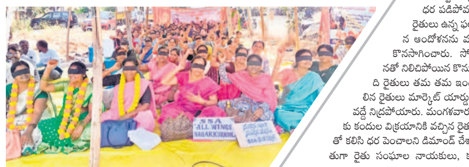
నాగర్ కర్నూల్లో కండ్లకు గంతులు కట్టుకొని ఉద్యోగుల నిరసన