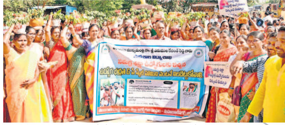
మహబూబ్ నగర్లో బోనాలతో ర్యాలీగా వెళ్తున్న ఎస్ఎస్పి ఉద్యోగులు