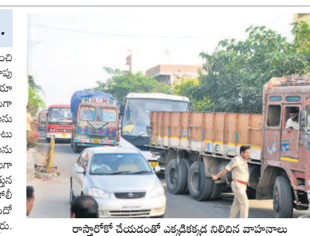
నారాయణపేట మార్కెట్ యార్డు ఎదుట రోడ్డుపై బైరెల్లె అల్లమని రాస్ట్రాకో కో చేపడుతున్న రైతులు

నారాయణపేట, డిసెంబర్ 17 : గత శనివారం ఒక్క రోజు మహారం ఒక్క రోజు నారాయణపేట వ్యవసాయ ఇంజనీరింగ్ ఓకే సారి కం ది క్రిందపై రూ. 2వేలకు పైగా ధర పడిపోవడంతో సోమవారం రైతులు కన్ను ఫలంగా మొదలు పెట్టి న ఆందోళనను మంగళవారం సైతం కొనసాగించారు. సోమవారం ఆందోళ నతో నిలిచిపోయిన కొనుగోళ్లలో కొంత మం ది రైతులు తమ తమ ఇండ్లకు వెళ్లిపోగా మిగి లిన రైతులు మార్కెట్ యార్డులో ధాన్యం కుప్పల వద్ద నిలబడిపోయారు. మంగళవారం మార్కెట్ యార్డు కు కందుల విక్రయానికి వచ్చిన రైతులు, నిన్నటి రైతుల తో కలిసి ధర పెంచాలని డిమాండ్ చేశారు. రైతులకు మద్ద తుగా రైతు సంఘాల నాయకులు, కమ్యూనిస్టు పార్టీల