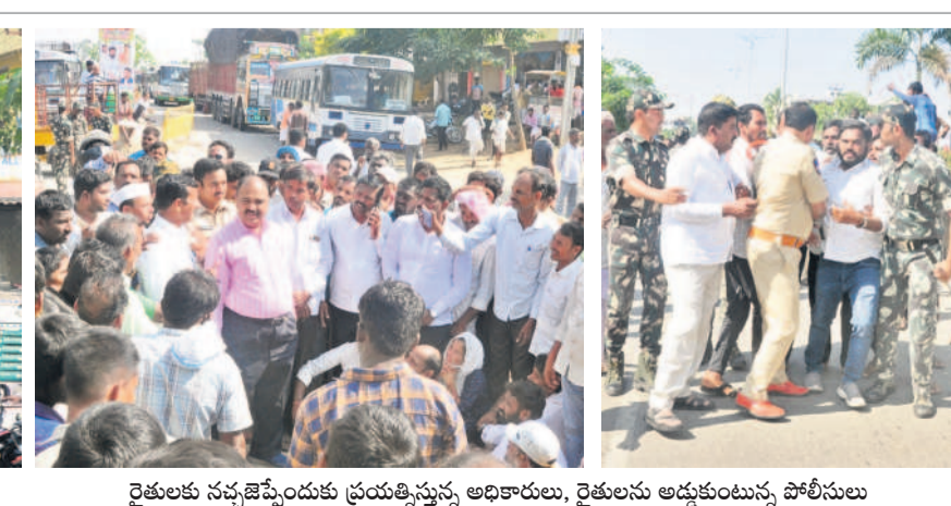
రైతులకు సచ్చెప్పేయకు ప్రయత్నిస్తున్న అధికారులు, రైతులను అడ్డుకుంటున్న పోలీసులు

ధర్మ చౌరస్ వద్ద ధర్మాకు దిగారు. కలెక్టర్ రావాలి తమ స మన్యలను పరిష్కరించాలని, రెండు రోజులుగా ఆందోళన చే పడుతున్నా ప్రభుత్వానికి వీమకుట్టినట్టుగా లేదని కాంగ్రెస్ ప్రభుత్వానికి వ్యతిరేకంగా పెద్ద ఎత్తున నినాదాలు చేశారు. వ్యాపారులంతా సిండికేట్గా మారి తమకు అన్యాయం చేస్తూ వ్యారసని మండిపడ్డారు. ధర్మా మొదలైన దాదాపు గంటన్నర తర్వాత అర్థివో రామచంద్రం అంబేద్కర్ చౌరస్ వద్దకు చేరు కొని రైతులతో మాట్లాడారు. రైతుల డిమాండ్పై మార్కెట్ అధికారులు, ఖరీదుదారులతో చర్చిస్తామని గంటల సమయం ఇవ్వాలని అంత వరకు ధర్మా విరమించాలని కోరడంతో అం బేద్కర్ చౌరస్ వద్ద రైతులు ధర్మా విరమించి, మార్కెట్