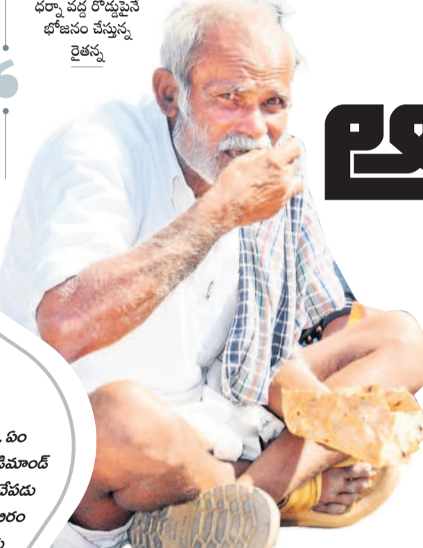
ధర్మా వద్ద రోడ్డుపైన భోజనం చేస్తున్న రైతులు

నారాయణపేట, డిసెంబర్ 17 : గత శనివారం ఒక్క రోజు మహారం ఒక్క రోజు నారాయణపేట వ్యవసాయ ఇంజనీరింగ్ ఓకే సారి కం ది క్రిందపై రూ. 2వేలకు పైగా ధర పడిపోవడంతో సోమవారం రైతులు కన్ను ఫలంగా మొదలు పెట్టి న ఆందోళనను మంగళవారం సైతం కొనసాగించారు. సోమవారం ఆందోళ నతో నిలిచిపోయిన కొనుగోళ్లలో కొంత మం ది రైతులు తమ తమ ఇండ్లకు వెళ్లిపోగా మిగి లిన రైతులు మార్కెట్ యార్డులో ధాన్యం కుప్పల వద్ద నిలబడిపోయారు. మంగళవారం మార్కెట్ యార్డు కు కందుల విక్రయానికి వచ్చిన రైతులు, నిన్నటి రైతుల తో కలిసి ధర పెంచాలని డిమాండ్ చేశారు. రైతులకు మద్ద తుగా రైతు సంఘాల నాయకులు, కమ్యూనిస్టు పార్టీల