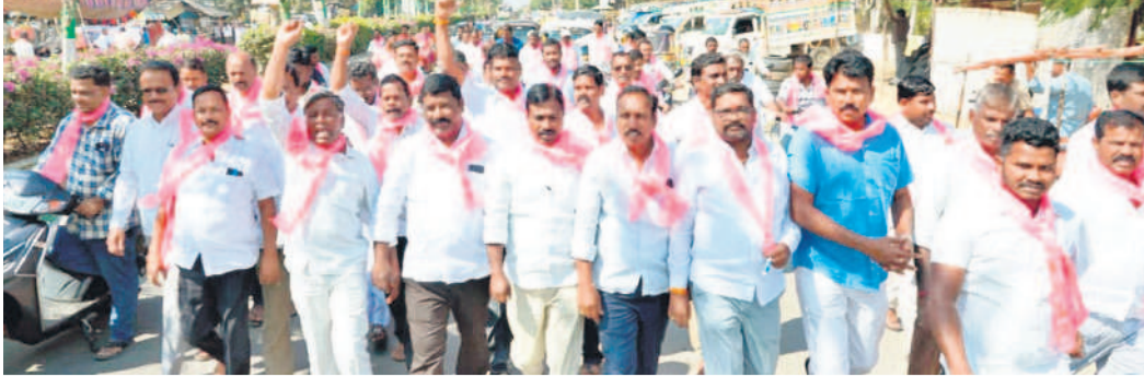
నాగర్ కర్నూల్ పట్టణంలో రాల్సి నిర్వహిస్తున్న టీఆర్ఎస్ నాయకులు