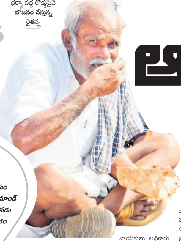
ధర్మ వద్ద రోడ్డుపైన భోజనం చేస్తున్న రైతున్న

నారాయణపేట, డిసెంబర్ 17 : గత శనివారంతో పోలీస్ సోమవారం ఒక్క రోజే నారాయణపేట వ్యవసాయ ఇంజనీరింగ్ ఓకే సారి కంపెనీ కింగ్ డెవలప్మెంట్ రూ.2వేలకు పైగా ధర పడిపోవడంతో సోమవారం రైతులు కన్ను ఫలంగా మొదలు పెట్టి స ఆందోళనను మంగళవారం సైతం కొనసాగించారు. సోమవారం ఆందోళనతో నిలిచిపోయిన కొనుగోలతో కొంత మంది రైతులు తమ తమ కండ్లకు మార్కెట్ యార్డర్ కుప్పల వద్ద నిలబెట్టారు. మంగళవారం మార్కెట్ యార్డుకు కందల విక్రయానికి వచ్చిన రైతులు, నిస్పృహ రైతులతో కలిసి ధర పెంచాలని డిమాండ్ చేశారు. రైతులకు మద్దతుగా రైతు సంఘాల నాయకులు, కమ్యూనిస్టు పార్టీల