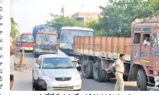
రాస్తారోకో చేయడంతో ఎక్కడిక్కడ నిలిచిన వాహనాలు

ప్రయాణికులకు తిప్పలు.. మంగళవారం ఉదయం 11:30 గంటల నుండి సాయంత్రం నాలుగున్నర గంటల వరకు ఏకాధిగా దాదాపు ఐదు గంటల పాటు రైతులు రాస్తారోకో నిర్వహించడంతో ప్రయాణికులు తీవ్ర ఇబ్బందులకు గురయ్యారు. రాస్తారోకో కారణంగా వాహనాలు కిలోమీటర్ల దూరంలో నిలిచిపోయాయి. అట్లనే బస్సులను మాత్రం పగడిమి, ఓబులాపూర్ మీదుగా ఊటూర్ రహదారిపై అటు సుందీ సింగారం చౌరస్తా మీదుగా మహబూబ్ నగర్, హైదరాబాద్ బస్సులను నడిపించారు. ఇక ద్వితీయ, నాలుగు చక్రాల వాహనాలు టీసీ కాలనీ మీదుగా బాబాకాలనీ వైపు నుండి వెళ్లాయి. లారీలు మాత్రం రెండు మార్కెట్ల వద్ద ఎత్తున నిలిచిపోయాయి. దాదాపు 5 గంటల పాటు రైతులు రాస్తారోకో చేపట్టినప్పటికీ పోలీసులు, మార్కెటింగ్ అధికారులు, అధికారి ఎంతో ఓపికగా సయమనం పాటించి అందోళన పక్కదారి పట్టుకుండా ఎన్నో జాగ్రత్తలు తీసుకున్నారు.