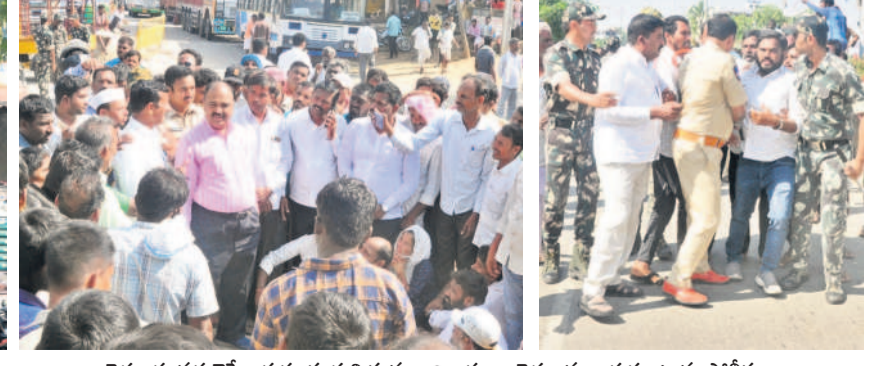
రైతులకు సర్దుబాటుకు ప్రయత్నిస్తున్న అధికారులు, రైతులను అడ్డుకుంటున్న పోలీసులు