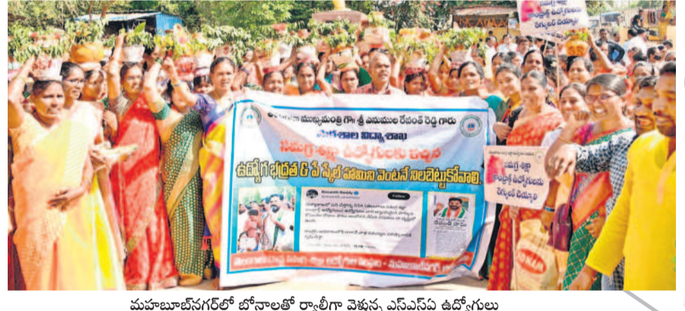
మహబూబ్ నగర్ లో బోనాలతో ర్యాలీగా వెళ్తున్న ఎస్ఎస్పి ఉద్యోగులు